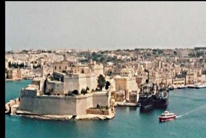
Крепость Святого Ангела на Мальте