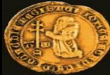
Печать Фердинанда Эредна, великого магистра госпитальеров ордена Святого Иоанна Иерусалимского (1384 г.). Орден, уже оставивший Иерусалим (1187 г.), Сен-Жанд'Акр (1291 г.), а затем и Кипр, с 1309 года расположился на острове Родос.