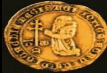
Печать Фердинанда Эредна, великого магистра госпитальеров ордена Святого Иоанна Иерусалимского (1384 г.). Орден, уже оставивший Иерусалим (1187 г.), Сен-Жанд'Акр (1291 г.), а затем и Кипр, с 1309 года расположился на острове Родос.