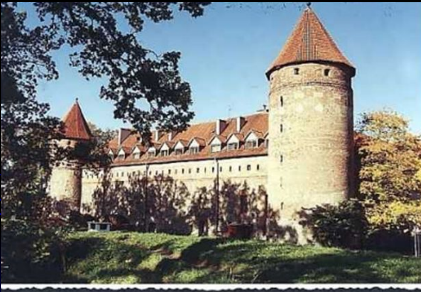
Тевтонский замок в Польше XIV века

Соединенными усилиями поляков, литовцев и представителей некоторых западнорусских княжеств в битве при Грюнвальде (1410г) орден был разгромлен и признал вассальную зависимость от Польши (1466г.). В 1525 году его владения в Прибалтике превращены в светское герцогство Пруссию.