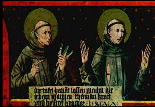
Святые Антоний Падванский и Франциск Ассизский. (Фридрих Пахер, 1477 год)

Большинство вступавших в монашеские ордены людей происходили из рыцарского сословия. Даже становясь монахами, они не складывали оружие и продолжали оставаться рыцарями.