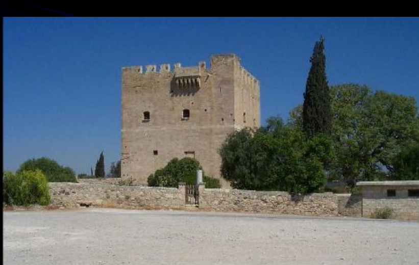
Замок на кипре, построенный тамплиерами