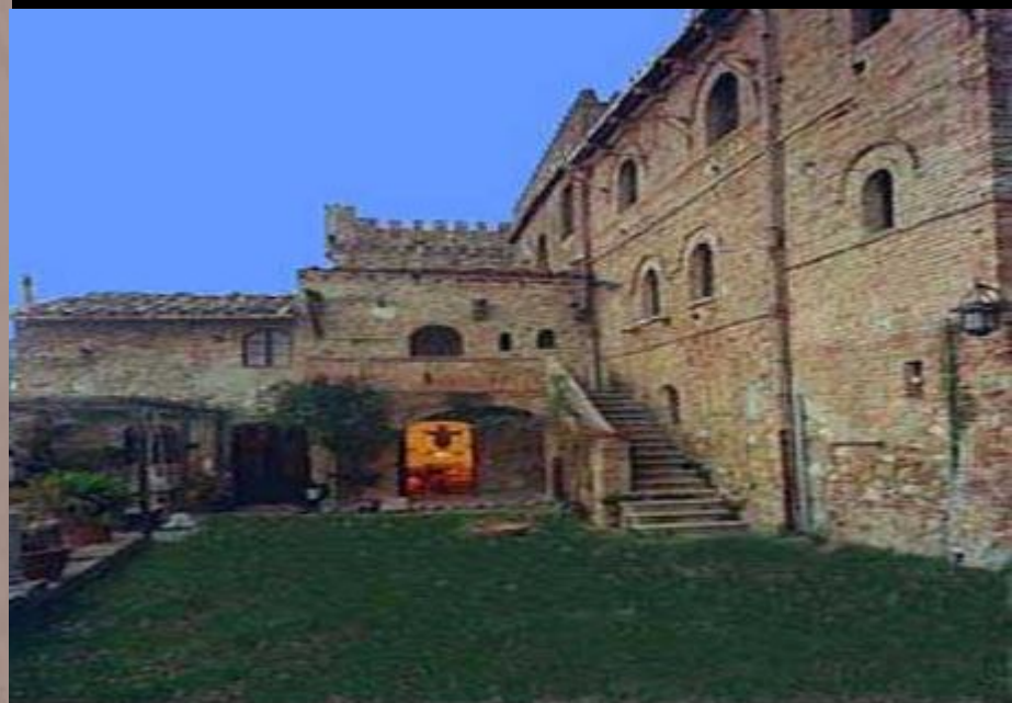
Двор замка тамплиеров в Иерусалиме XIII века

Еще одна печать тамплиеров — с изображением Церкви Гроба Господня.