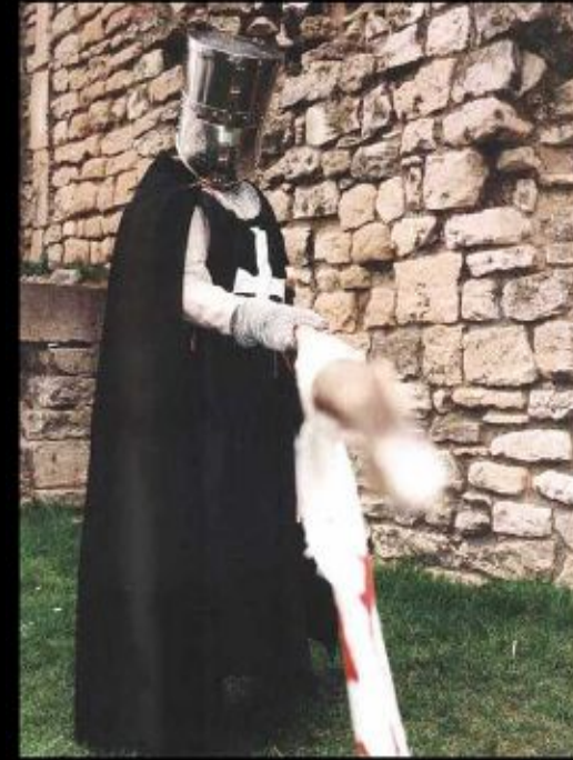
Рыцарь ордена госпитальеров. Современная реконструкция