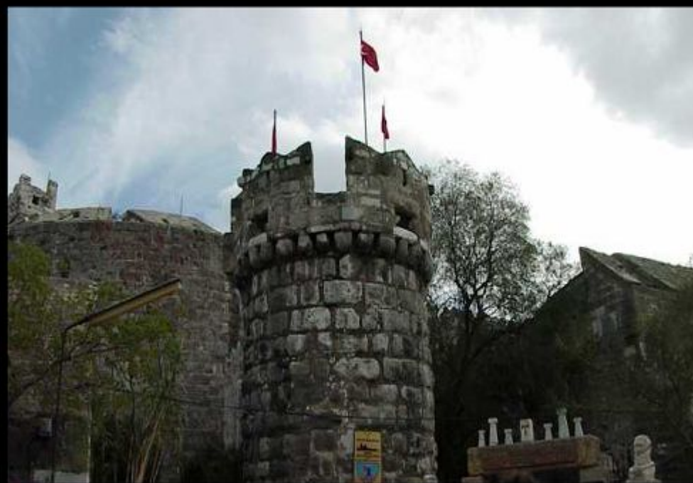
Замок госпитальеров в Бодруме