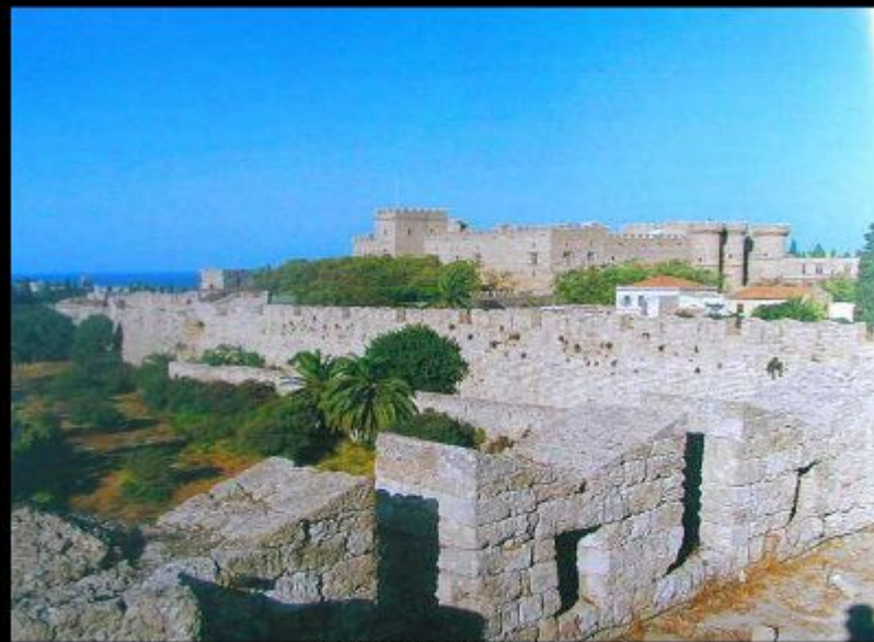
Замок ионнитов на Родосе