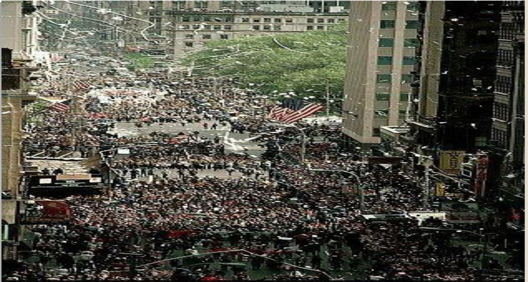
Парад ветеранов войны во Вьетнаме 1985 год. Нью Йорк.