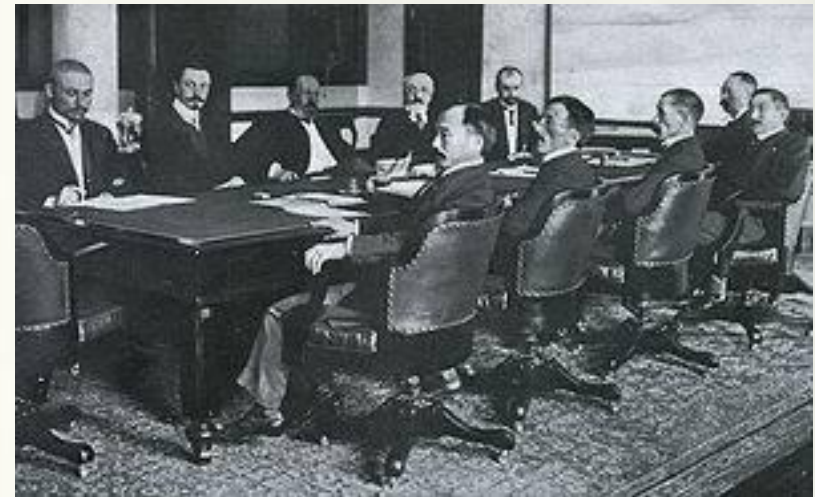
Слева направо: с русской стороны (дальняя часть стола) — Г. А. Плансон, К. Д. Набоков, С. Ю. Витте, Р. Р. Розен, И. Я. Коростовец; с японской стороны (ближняя часть стола) — Адати (нем.), Отиай, Комура (англ.), Такахира (англ.), Сато