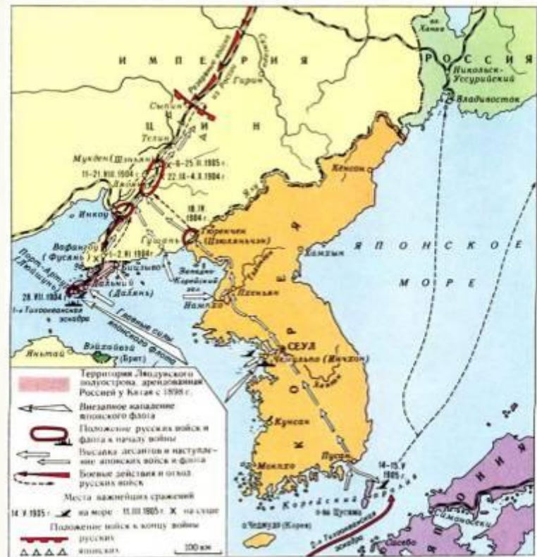
Русско-Японская война 1904-1905 гг.