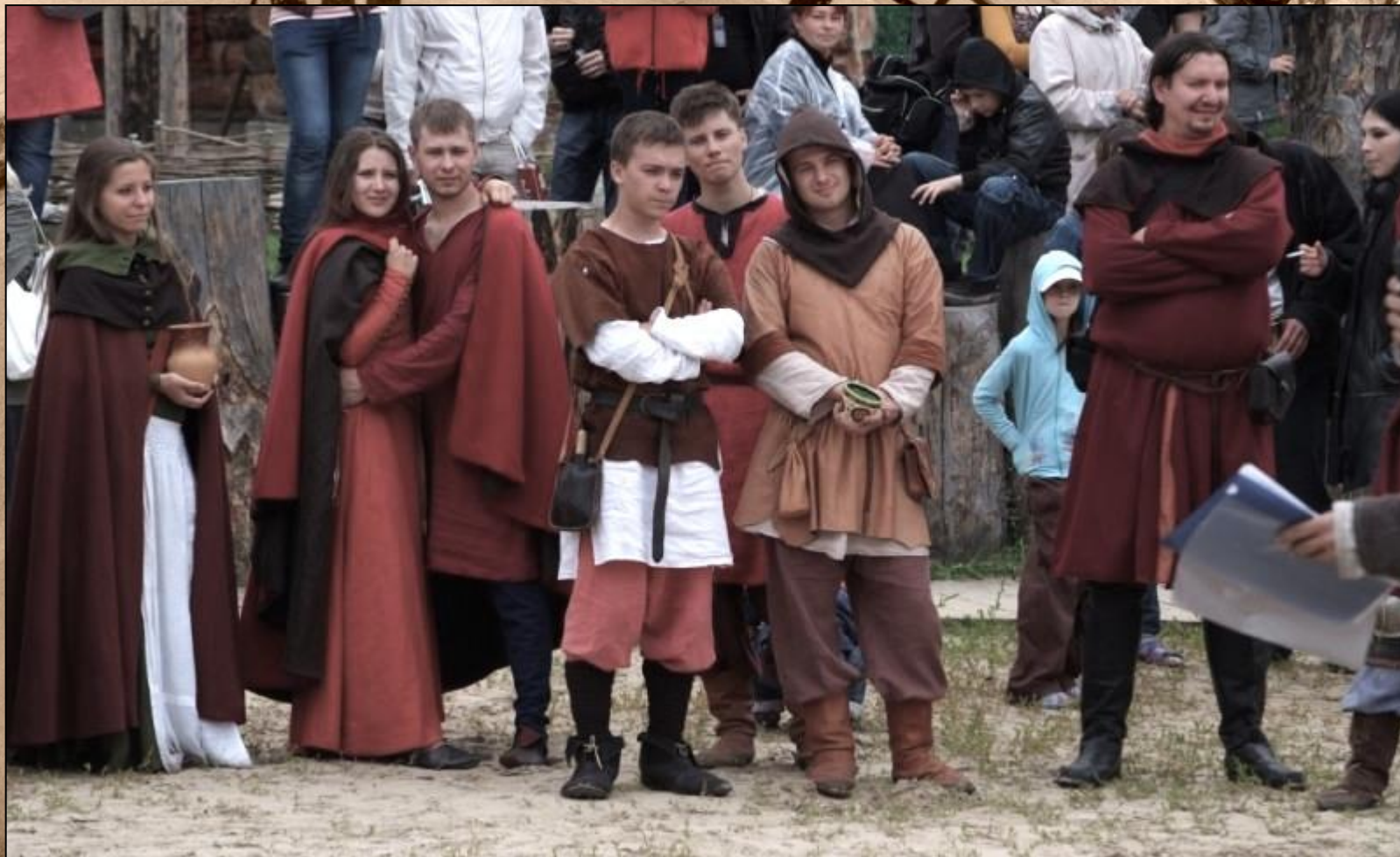
горожане, историческая реконструкция