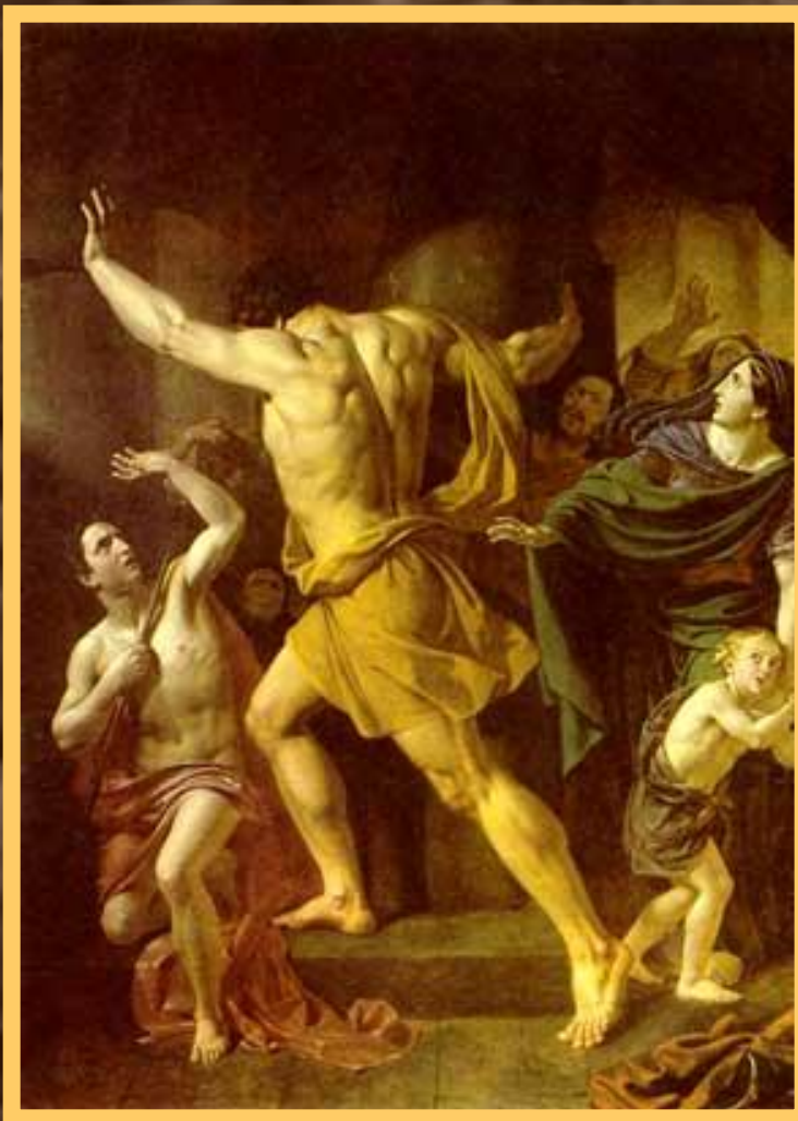
Самсон разрушает храм филистимлян.

Один из евреев Самсон обладал огромной силой. Он полюбил красавицу Далилу и та узнала, что его сила кроется в волосах. Спящего Самсона остригли и связали. Он был ослеплен и брошен в темницу. Филистимляне устроили пир и стали издеваться над Самсоном. Но его волосы уже отрасли. Самсон схватился за колонны и обрушил здание.