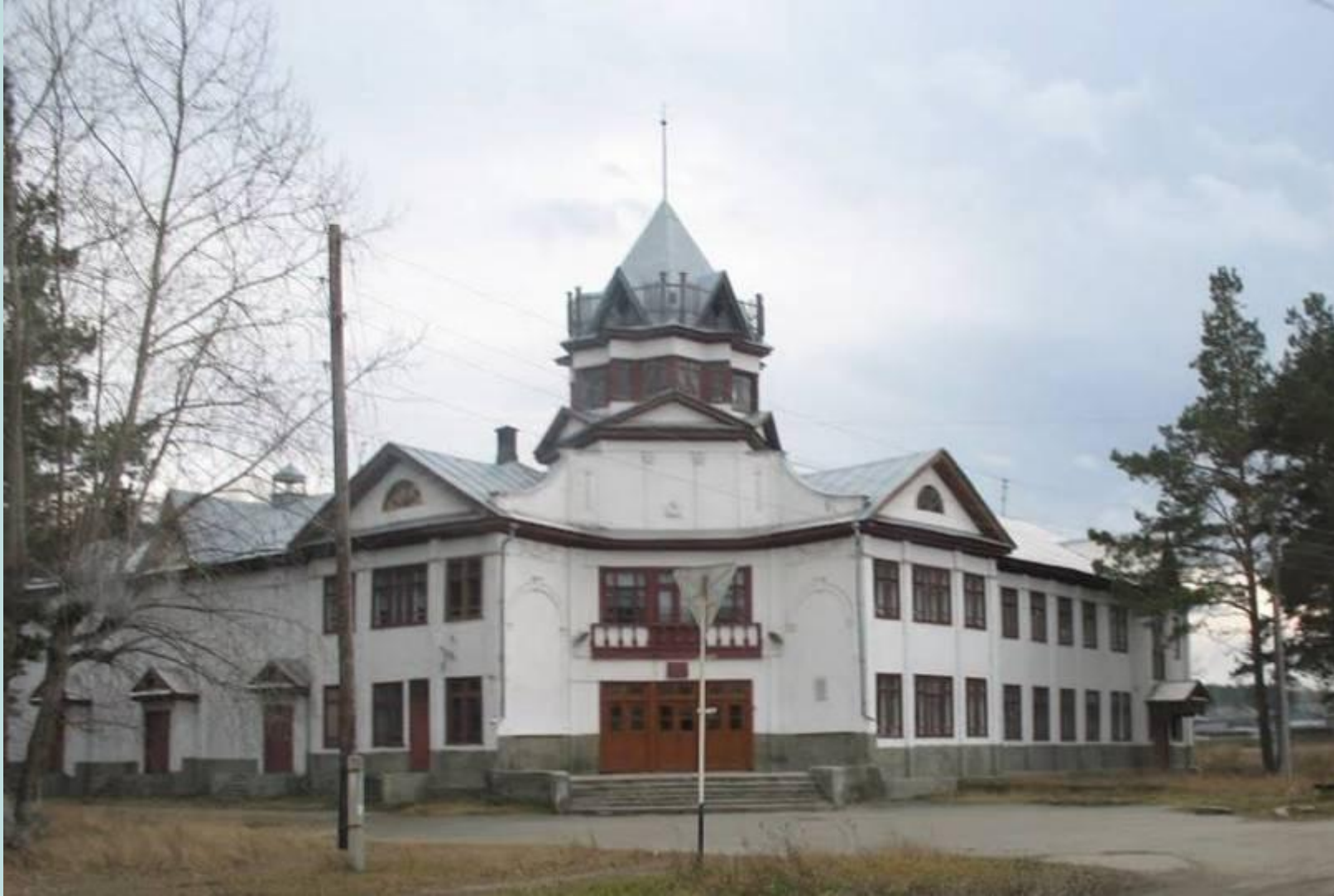
быв. Тавдинский Дом пионеров им. Павлика Морозова (клуб имени Ф.Э. Дзержинского)