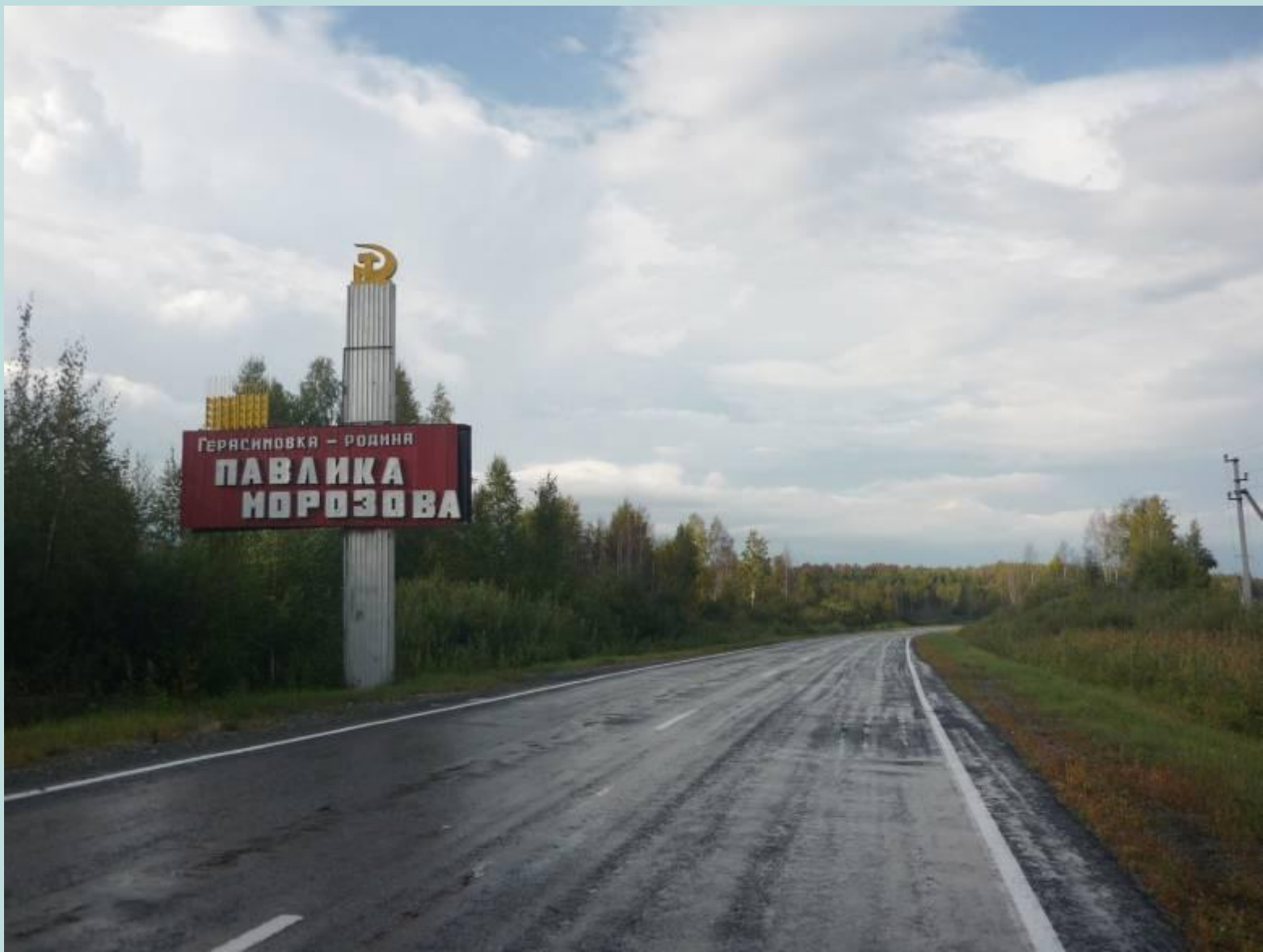
дорога в Герасимовку