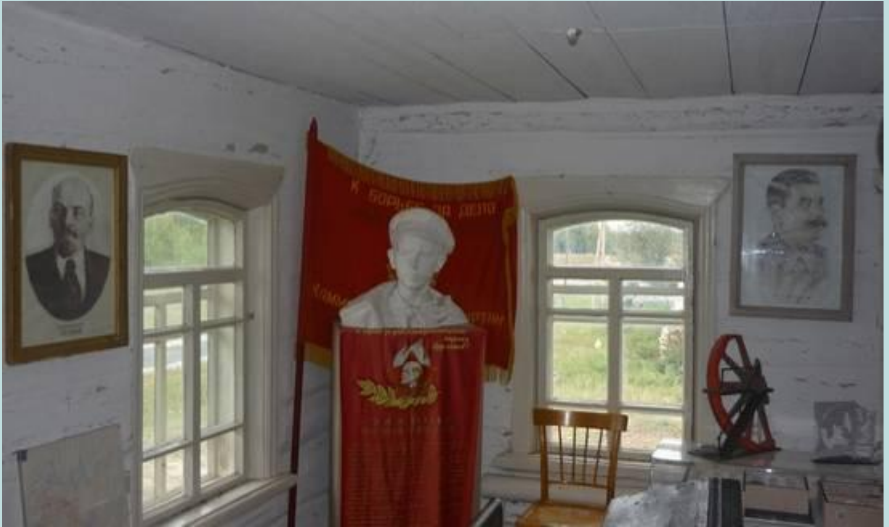
Тавдинский район, Герасимовка, музей