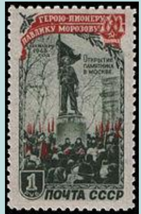
почтовая марка, 1950 г.