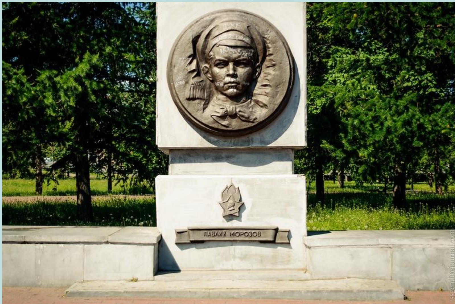
Челябинский мемориал в честь пионеров-героев на Алом поле