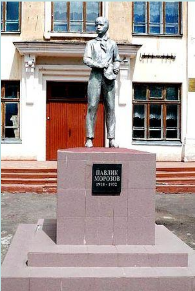
Памятник Павлику Морозову в городе Острове