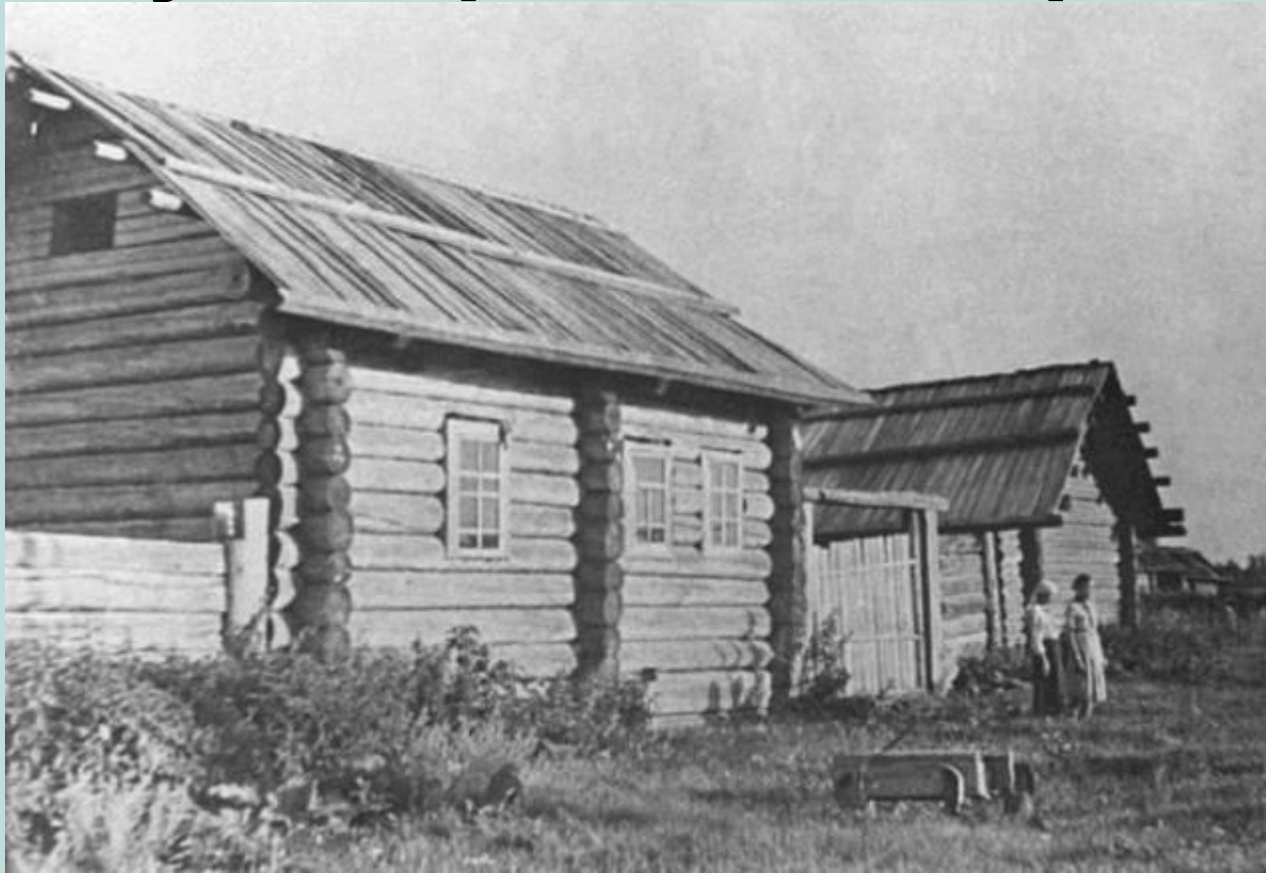
Герасимовка. Дом Морозовых, фото 50-х годов.