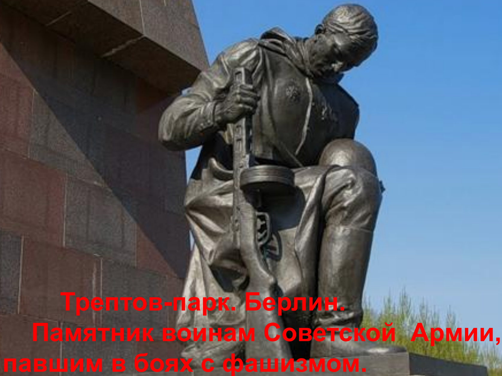
Трептов-парк. Берлин. Памятник воинам Советской Армии, павшим в боях с фашизмом.