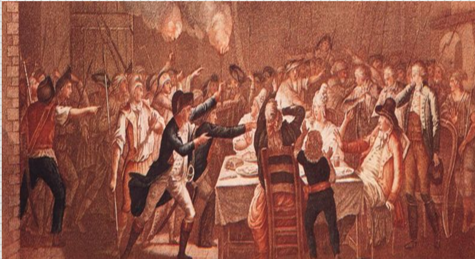
Арест Людовика XVI.