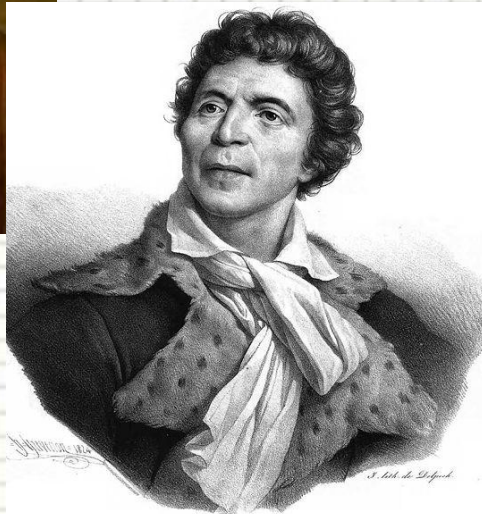
Жан Поль Марат