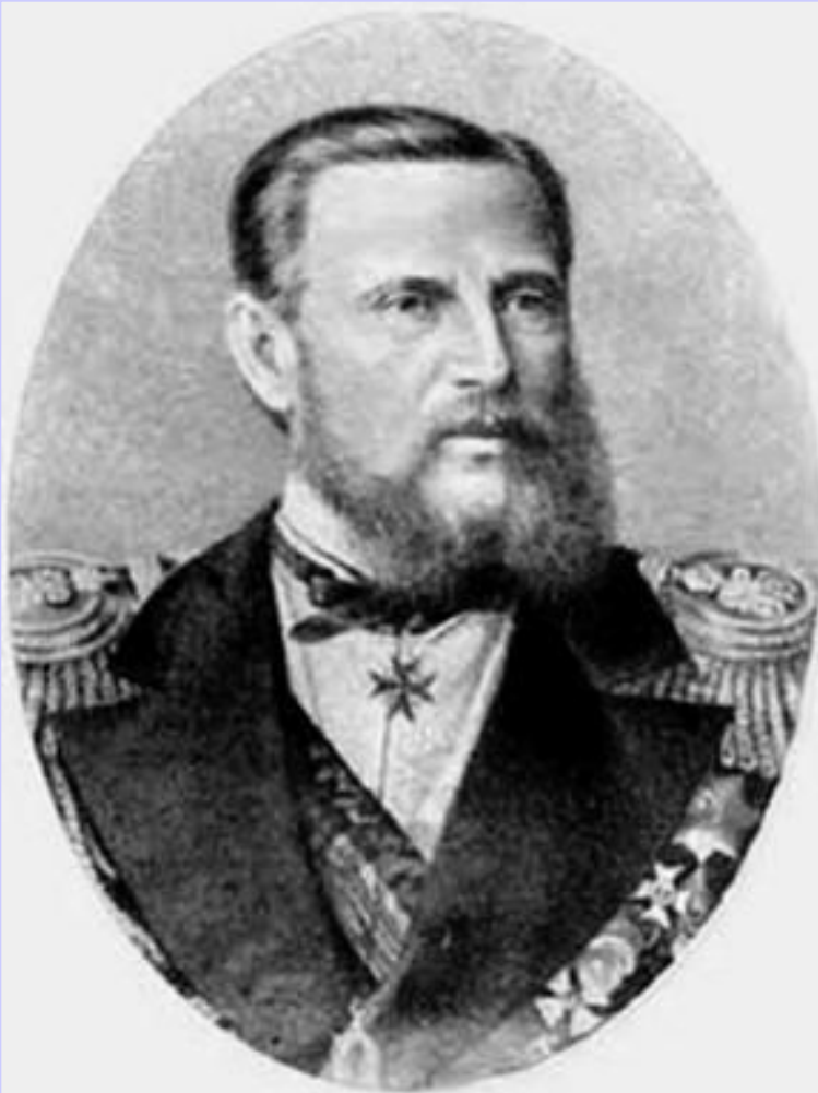
Великий князь Константин Николаевич

Необходимость освобождения осознали и в верхах. За него выступали великие князья Елена Павловна и Константин Николаевич.