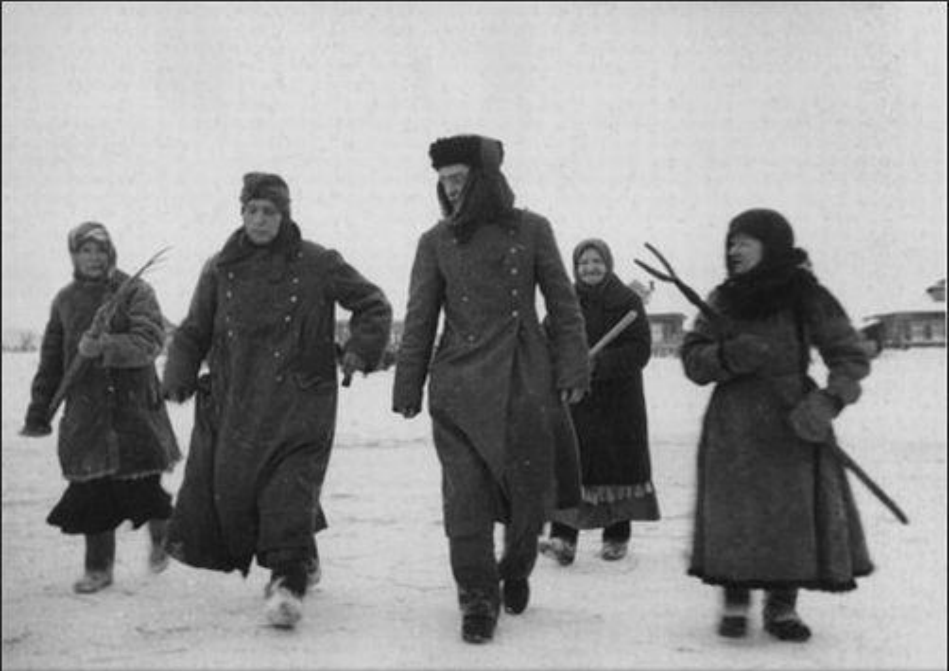
Мирные жители ведут пленных фашистов под Москвой 1942 год