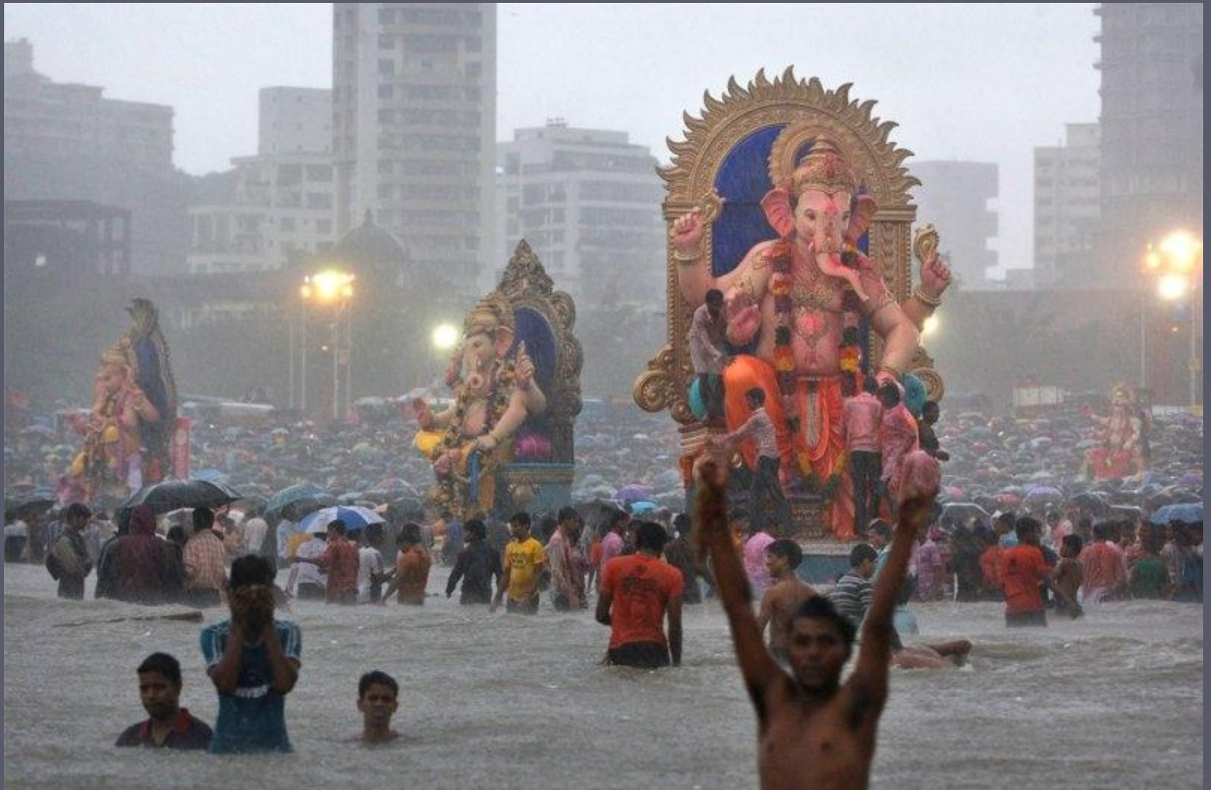
Религиозный обряд в честь празднования рождения Ганеши