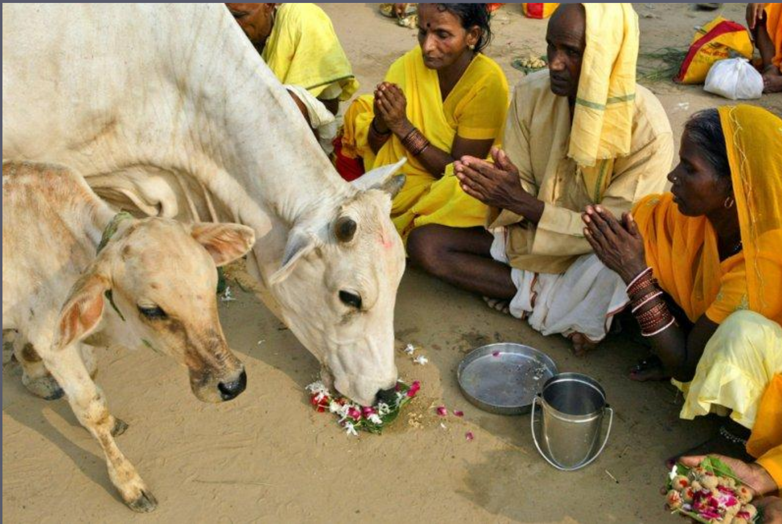
Обряд почитания священного животного