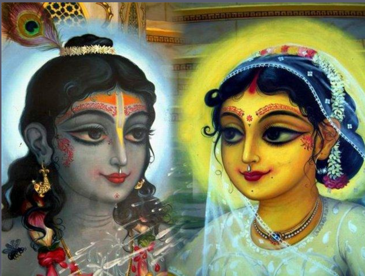
Кришна с супругой