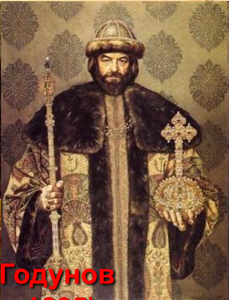
Борис Годунов (1598 – 1605)