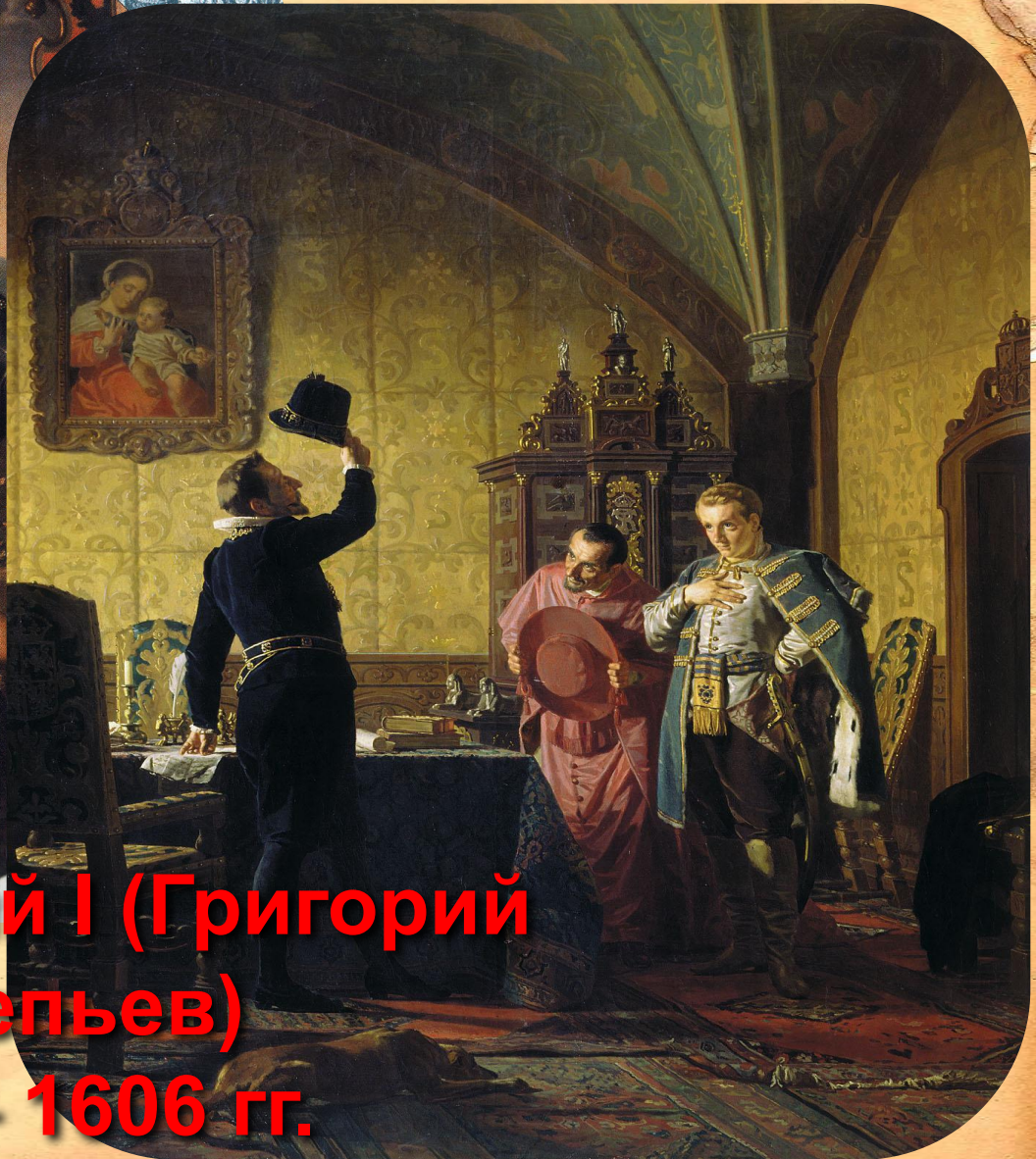
Лжедмитрий I (Григорий Отрепьев) 1605 – 1606 гг.