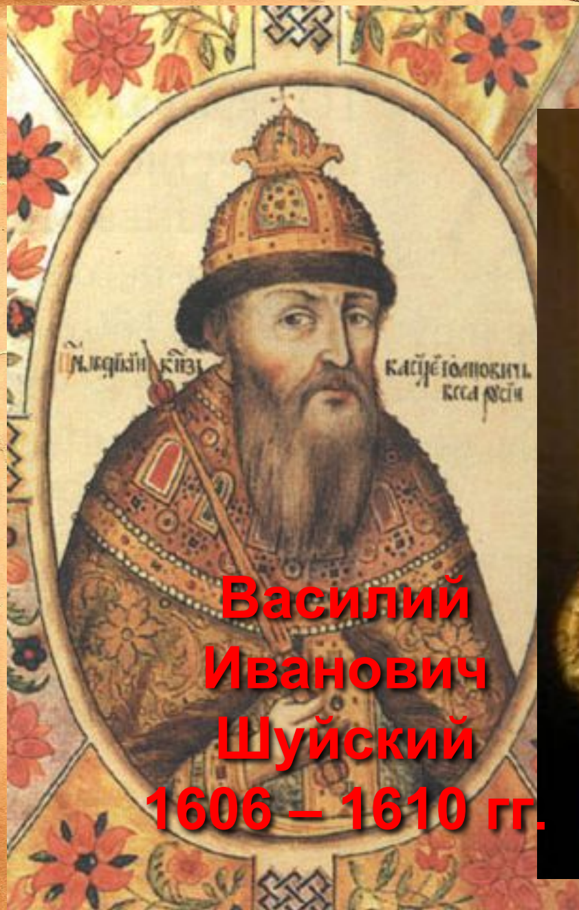
Василий Иванович Шуйский 1606 – 1610 гг.