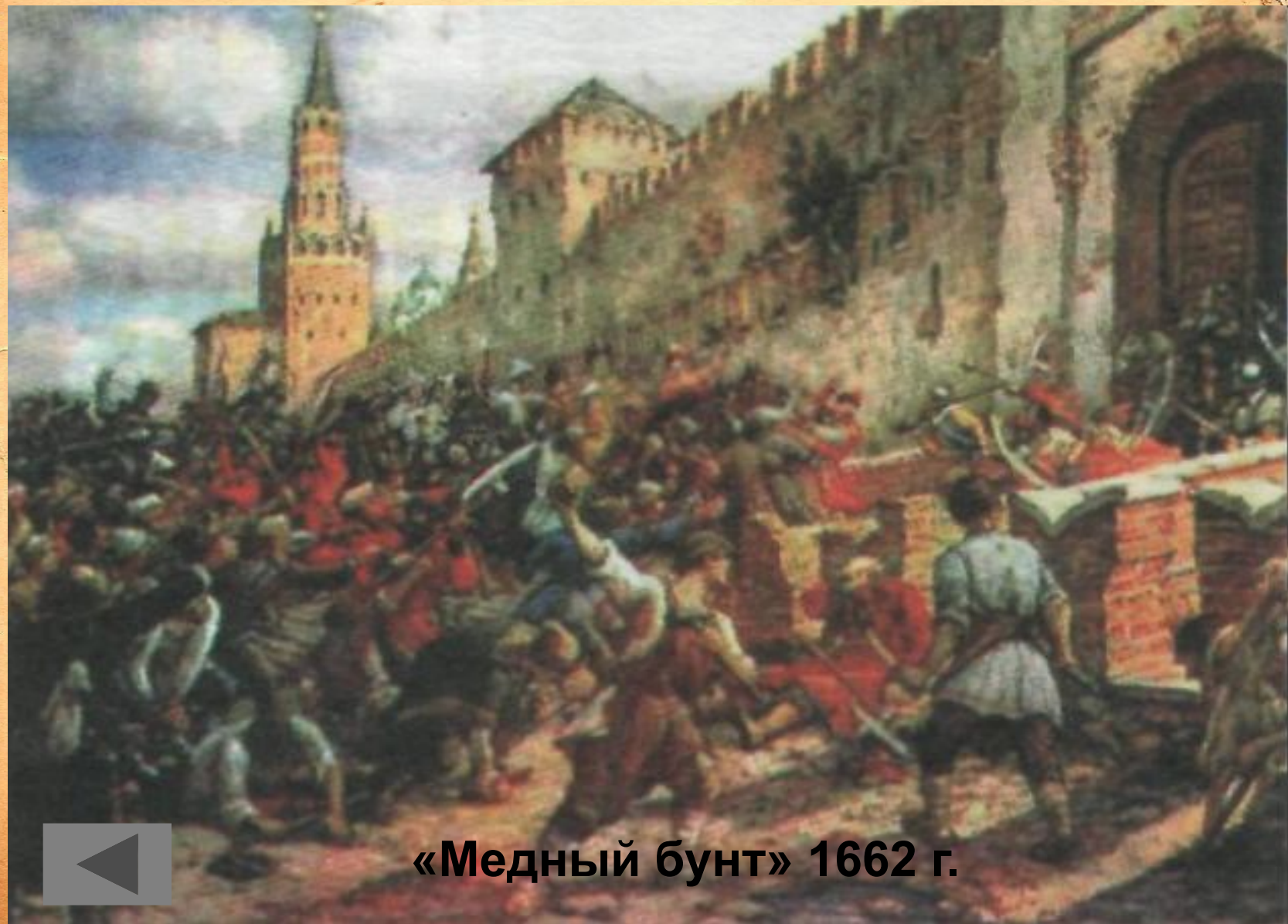
«Медный бунт» 1662 г.