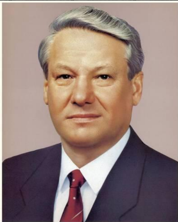
Борис Николаевич ЕЛЬЦИН