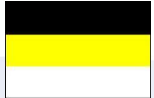
Государственный флаг Российской Империи