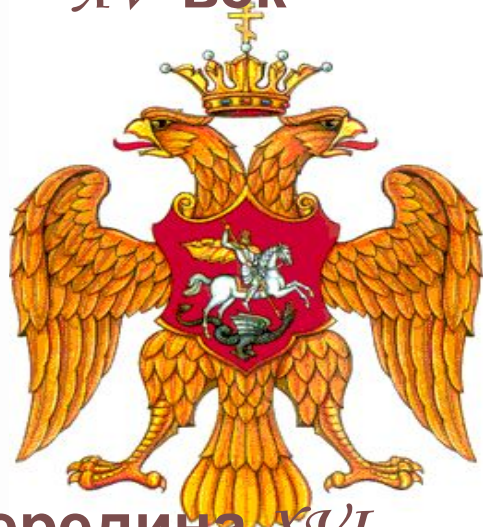
Середина XVI века