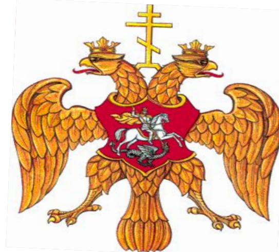
Конец XVI – начало XVII века