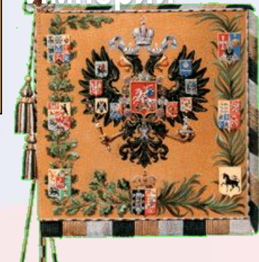
Государственное знамя Российской Империи