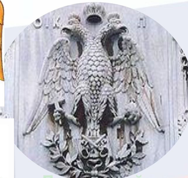
Двуглавый орел в Византии