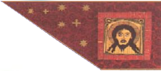
Знамя Ивана Грозного