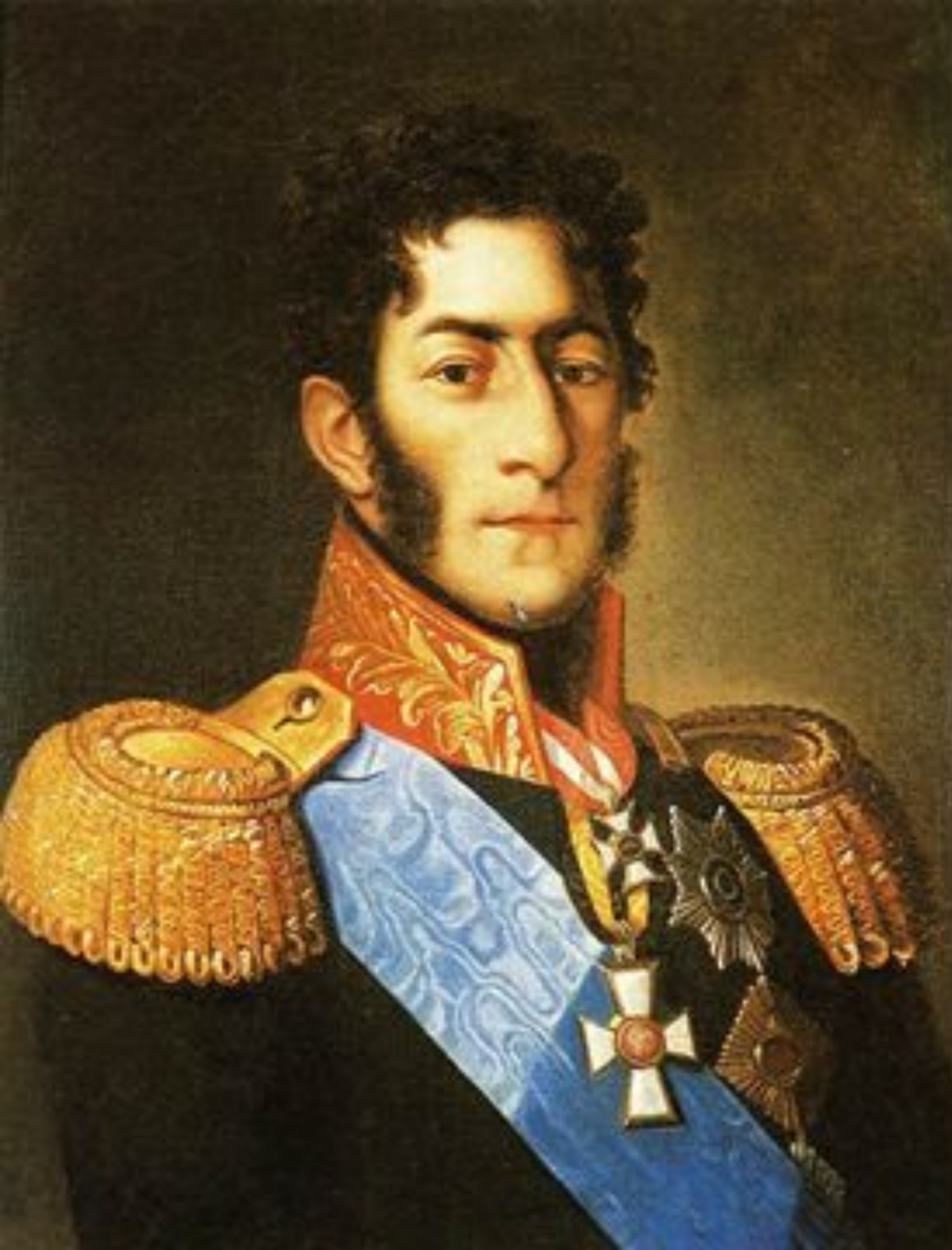
ПЁТР ИВАНОВИЧ БАГРАТИОН КОМАНДУЮЩИЙ 2-й ЗАПАДНОЙ АРМИЕЙ РУССКОЙ ИМПЕРИИ