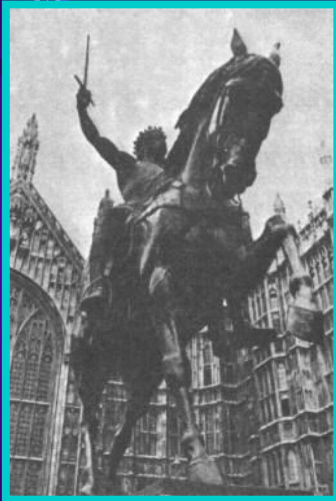
Памятник Ричарду Львиное Сердце у английского парламента.

По приказу Ричарда англичане перебили в Акре 2 тысячи мусульман.