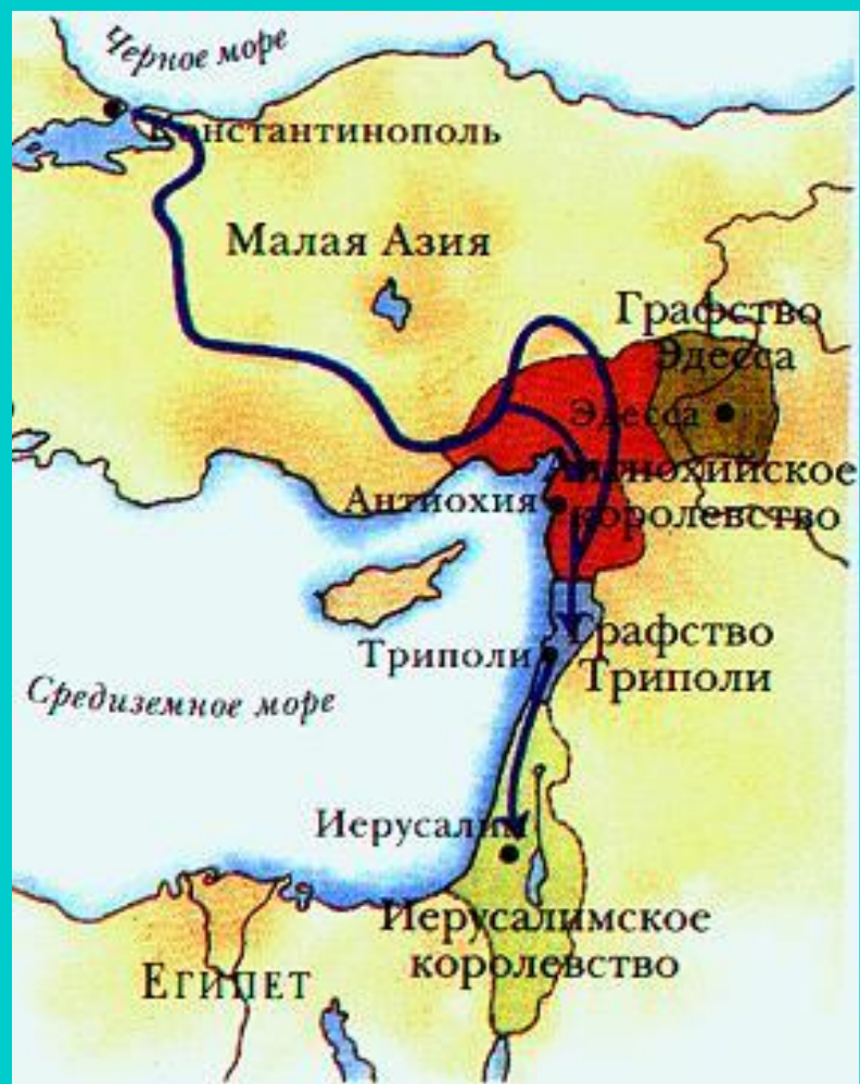
Государства крестоносцев в Малой Азии.

Со временем владения крестоносцев в Палестине уменьшались. С развитием хозяйства рыцарям стало выгоднее заниматься поместьем, чем воевать.