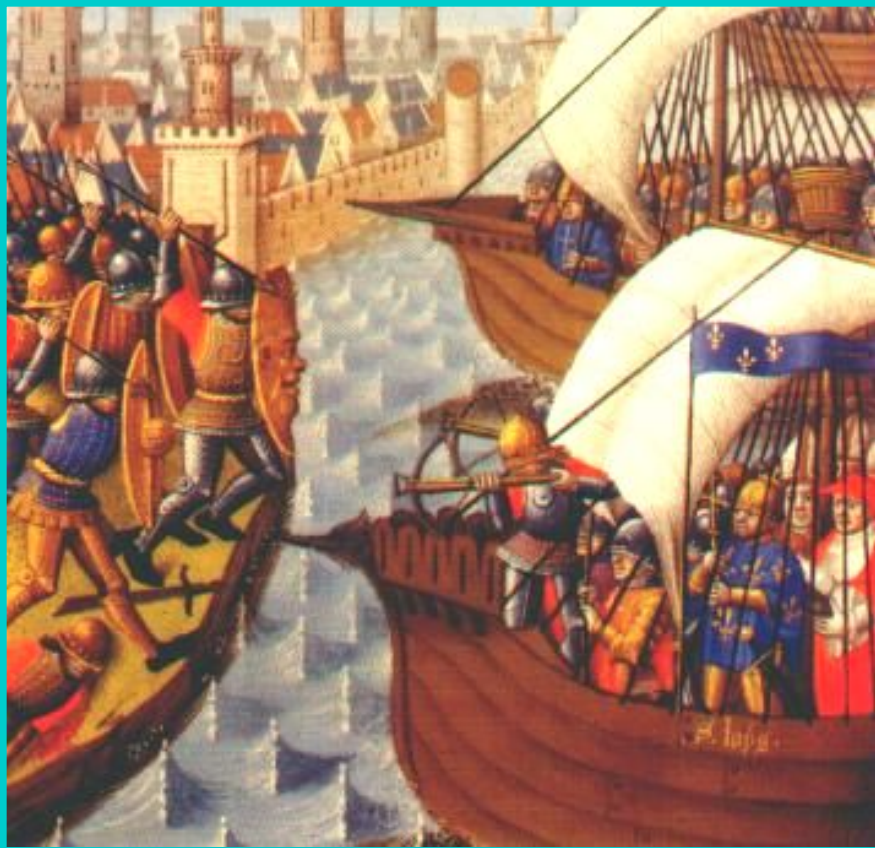
Пираты и крестоносцы.

В 1212 г. в поход вновь двинулись толпы бедняков по призыву проповедника Франциска Алоизского. Добравшись до Генуи бедняки разделились. Часть детей купцы посадили на корабли, но суда попали в бурю. Уцелевшие участники похода были проданы в рабство.