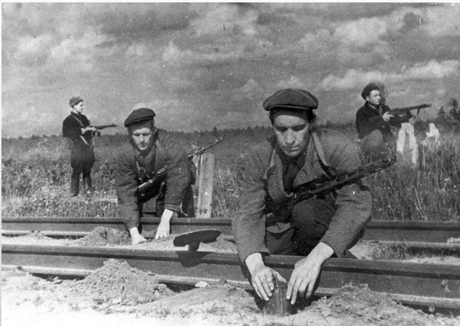
Операция «Рельсовая война»