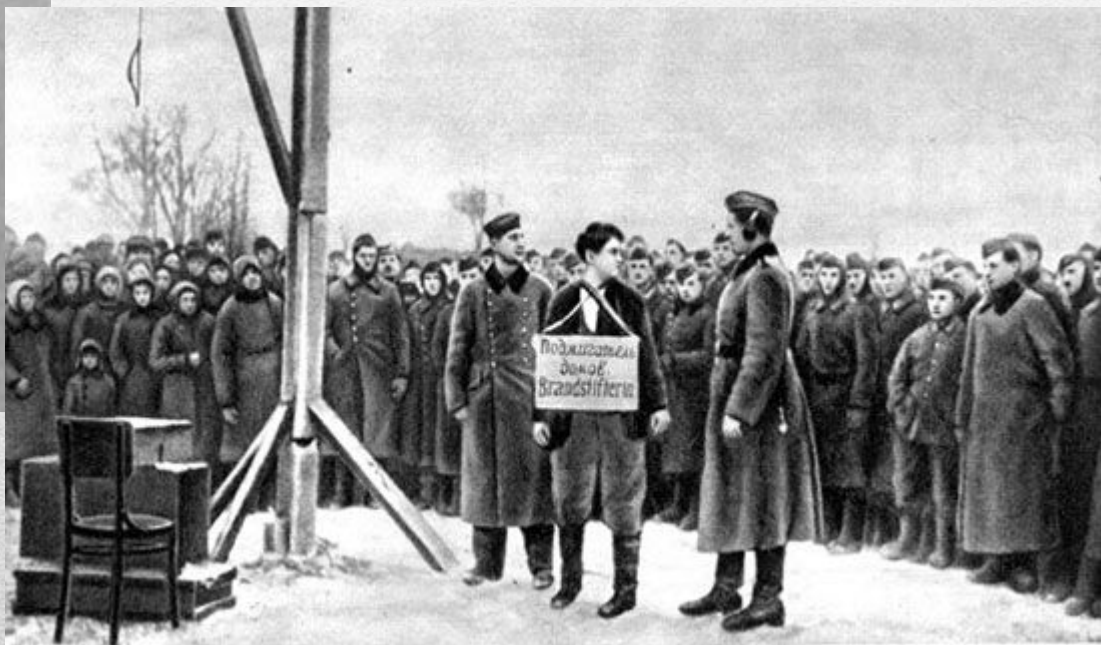
Зоя Анатольевна Космодемьянская