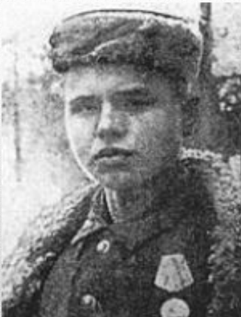
Леонид Александрович Голиков