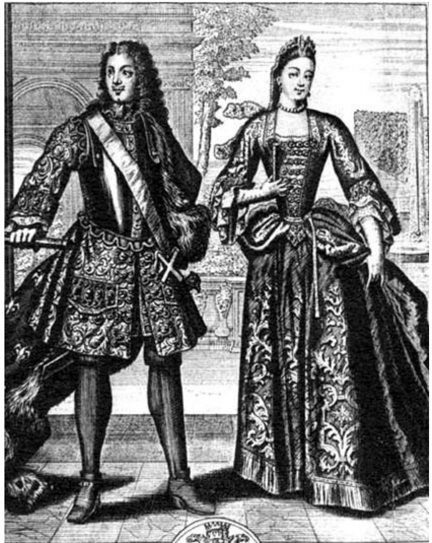
Пётр 1 и Марта (Екатерина)