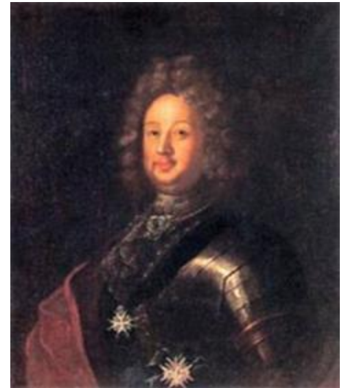
Граф Б.П. Шереметев