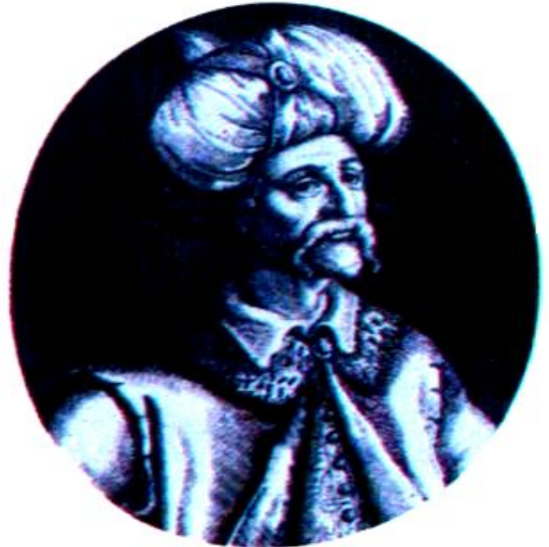
Пророк Мухаммед. Французская гравюра

В 630 году знать подписала договор с Мухаммедом и большинство арабов приняли ислам и признали власть Мухаммеда, который стал главой арабского государства и мусульманской церкви. На Аравийском полуострове образовалось арабское государство.