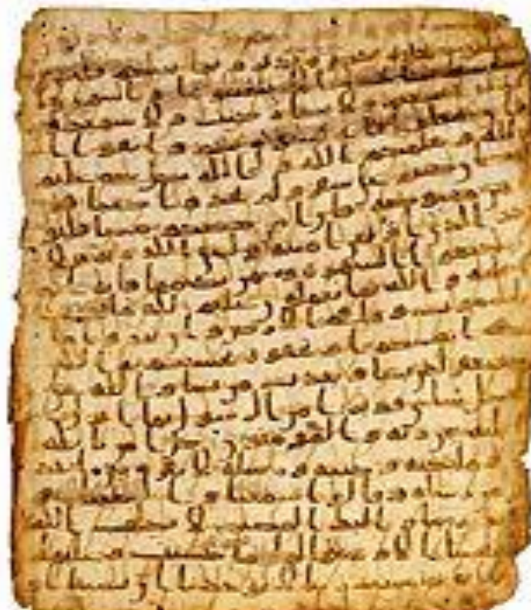
Рукопись Корана VII в