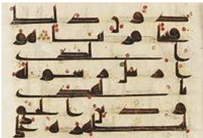
Страница из Корана

Ислам - «покорный Аллаху». Коран – «чтение», священная книга мусульман. Коран состоит из 114 глав, называемых суры . Сунна — рассказы (хадисы) о поступках и изречениях Мухаммеда Мусульманин (от араб, «муслин») — уверовавший.