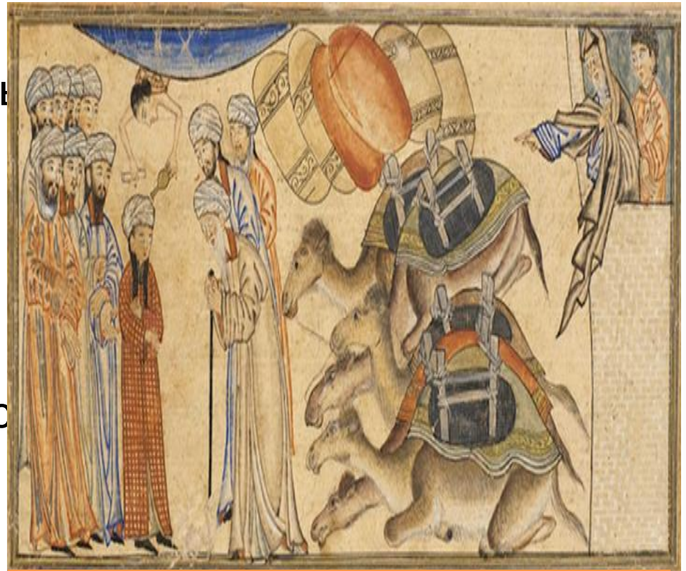
Ярмарки в Мекке

Во время этих ярмарок наступал мир, запрещались ссоры и столкновения