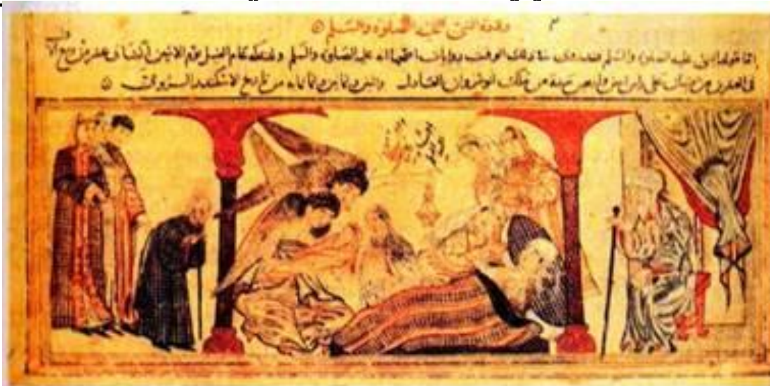
Рождение пророка Мухаммеда. Миниатюра XIV

Объединение арабских племен было ускорено борьбой с внешними врагами. В конце 6 века Иран захватил южную часть Аравийского полуострова, а Византия укрепилась на севере. Арабская торговля была нарушена. Арабские племена не могли объединиться без единой веры. Богом всех арабов стал Аллах, который воспринимался как создатель мира и людей. Пророком и истолковат