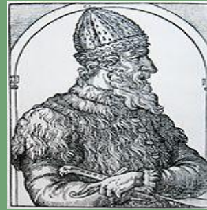
Иван III (1462-1505)