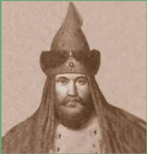
Василий I 1389-1425