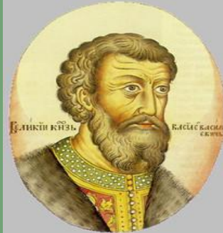
Василий II (1425-1462)