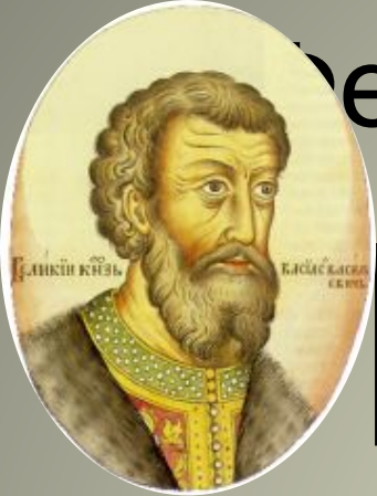
Василий II Васильевич Темный (1425-1462)