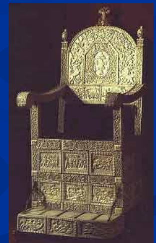
Трон Ивана Грозного