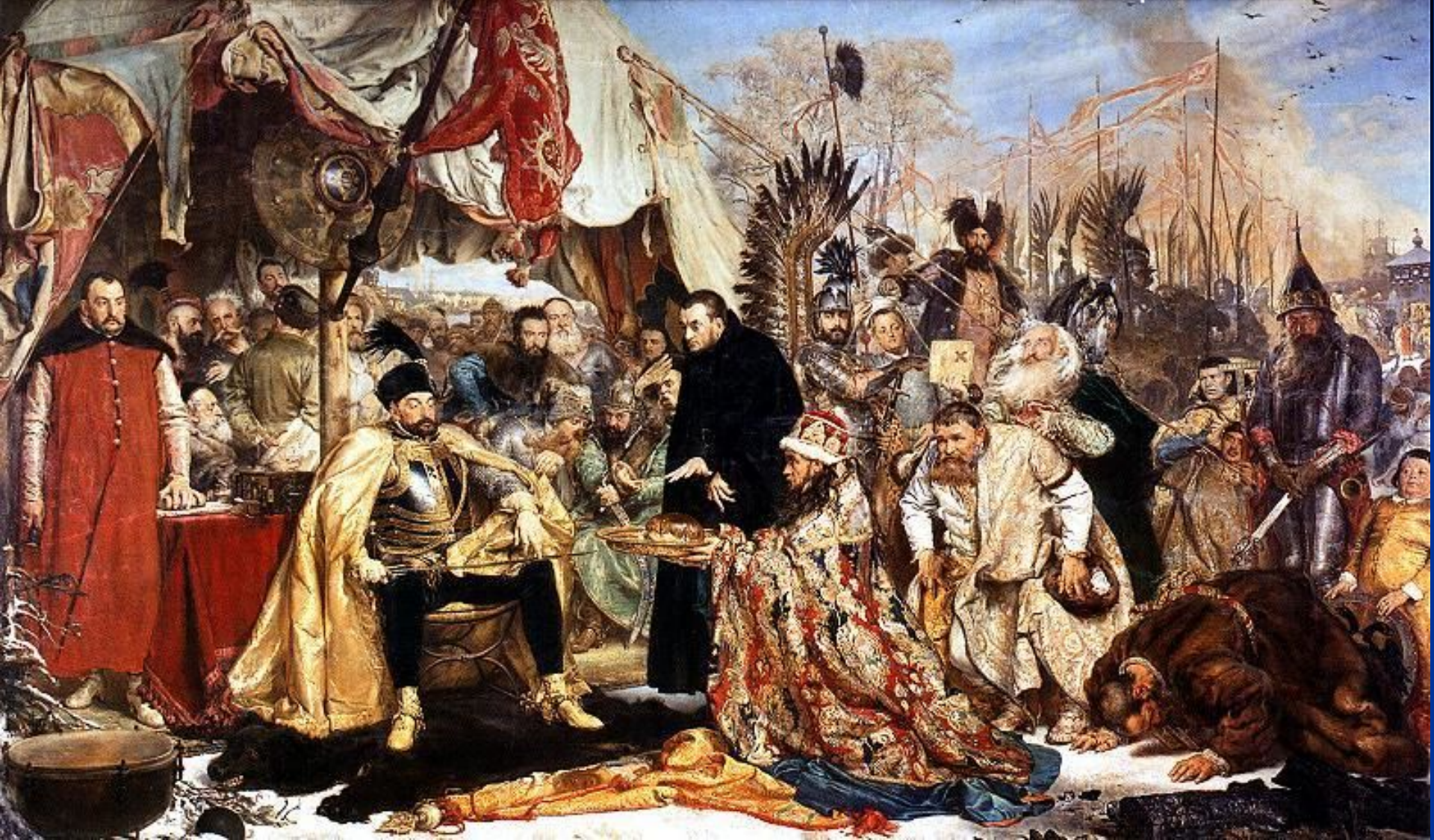
Ян Матейко. « Стефан Баторий под Псковом ».