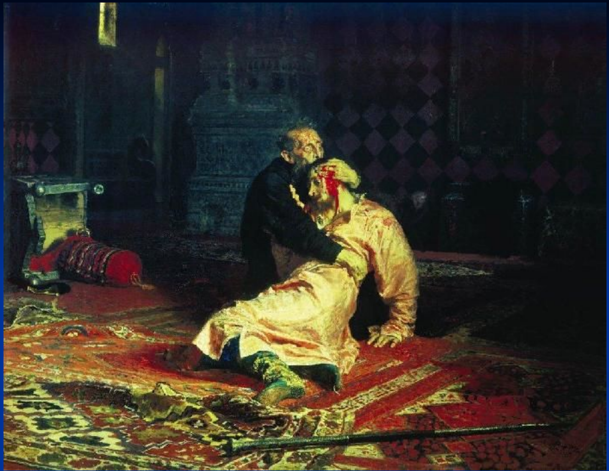
И.Е. Репин. Иван Грозный и его сын Иван 6 ноября 1581 года.

В ноябре 1581 года Иван Васильевич в порыве гнева убил железным посохом своего старшего сына, который под руководством отца приобрел кровожадные привычки и подавал надежду на то, что после его смерти будет продолжать его политику. Причина этого события в разных источниках трактуется по-разному.