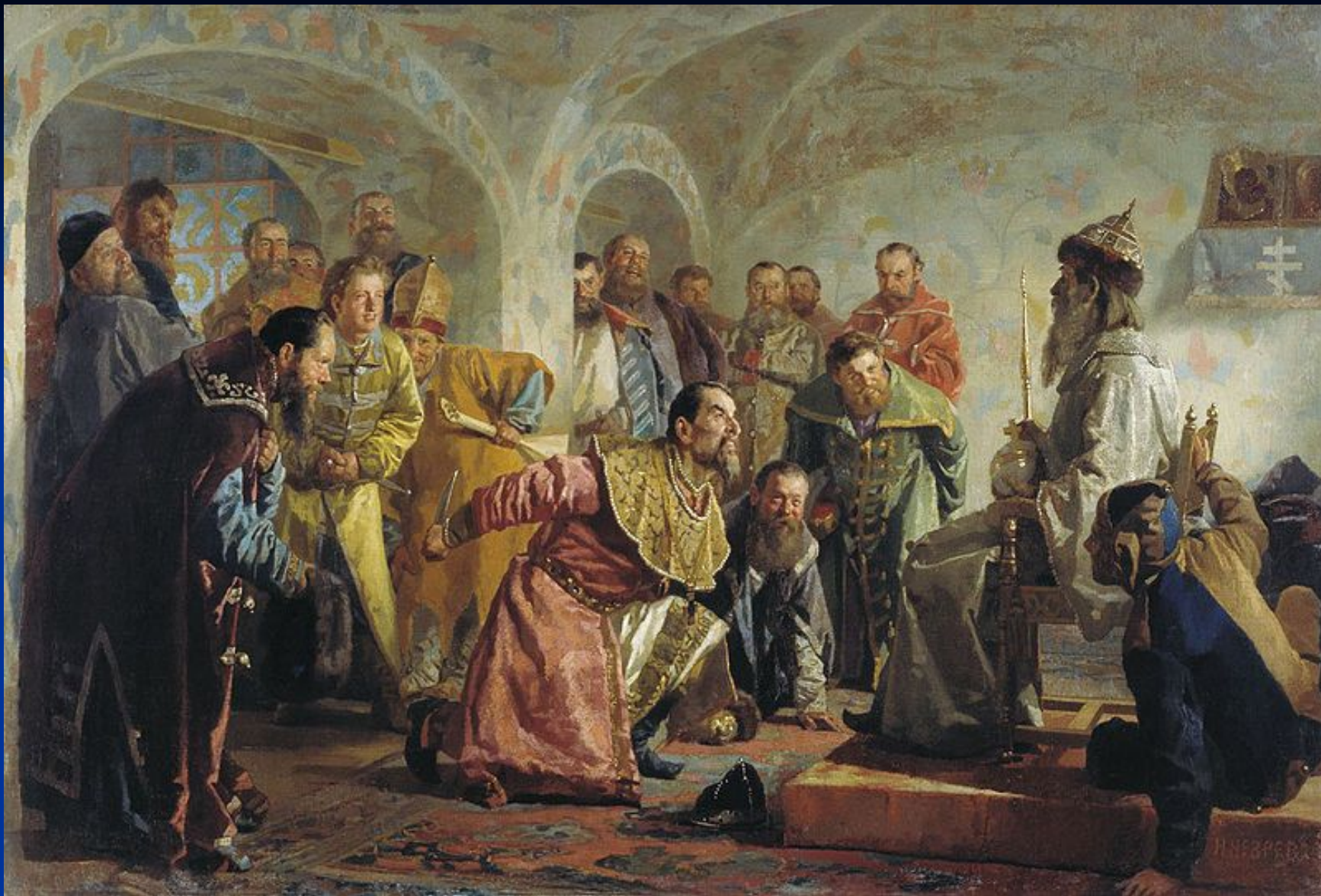
Картина Н. В. Неврева «Опричники». Изображено убийство боярина И. П. Фёдорова (1568), которого Грозный, обвинив в желании захватить власть, заставил надеть царские одежды и сесть на трон, после чего зарезал