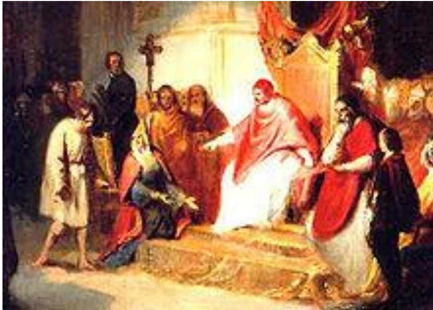
Генрих IV и Григорий VII в Каноссе в 1077, картина Карло Эммануэля