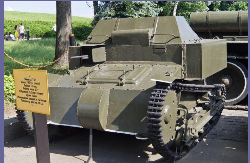
41 Танкетка Т-27 зроблена 1931 р. (намає) Бойова вага 2,3 т Силова вага 2,7 т Оборонення 7,62 мм кулемет Броня 16 мм Максимальна швидкість 42 км/год Потужність двигуна 40 к.с.