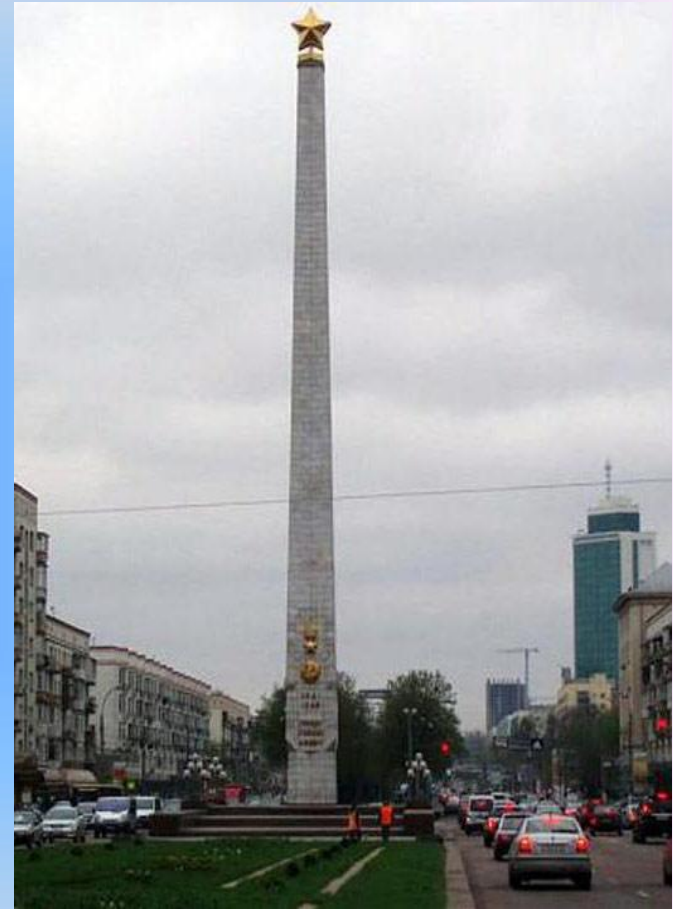
Обелиск Город - Герой