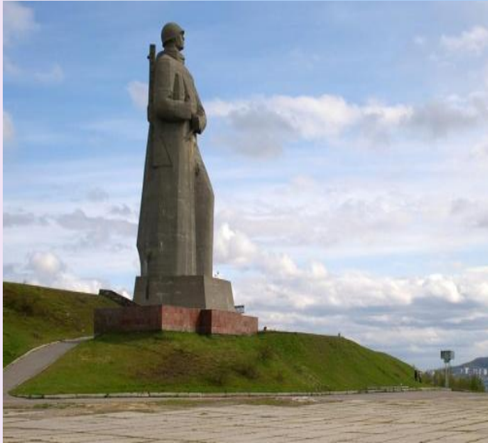
Мемориал Защитникам Советского Заполярья в годы Великой Отечественной войны

Военная история Мурманска обусловлена наступлением в 1941 году немецко-фашистской армии сразу по нескольким фронтам. Так для захвата земель Заполярья, со стороны Норвегии и Финляндии, был развернут фронт «Норвегия». В планах фашистских захватчиков было нападение на Кольский полуостров. Оборона полуострова была развернута на Северном фронте, полосе протяженностью в 500 км. В обороне участвовали корабли Северного флота и сухопутные войска Советской армии, защищая Заполярье от вторжения немецких войск.