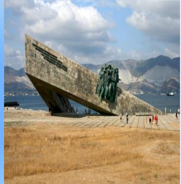
Город герой Новороссийск. Мемориал "Малая земля".

Сражение за Новороссийск длилось 225 дней и закончилась полным освобождением города-героя 16 сентября 1943 г.