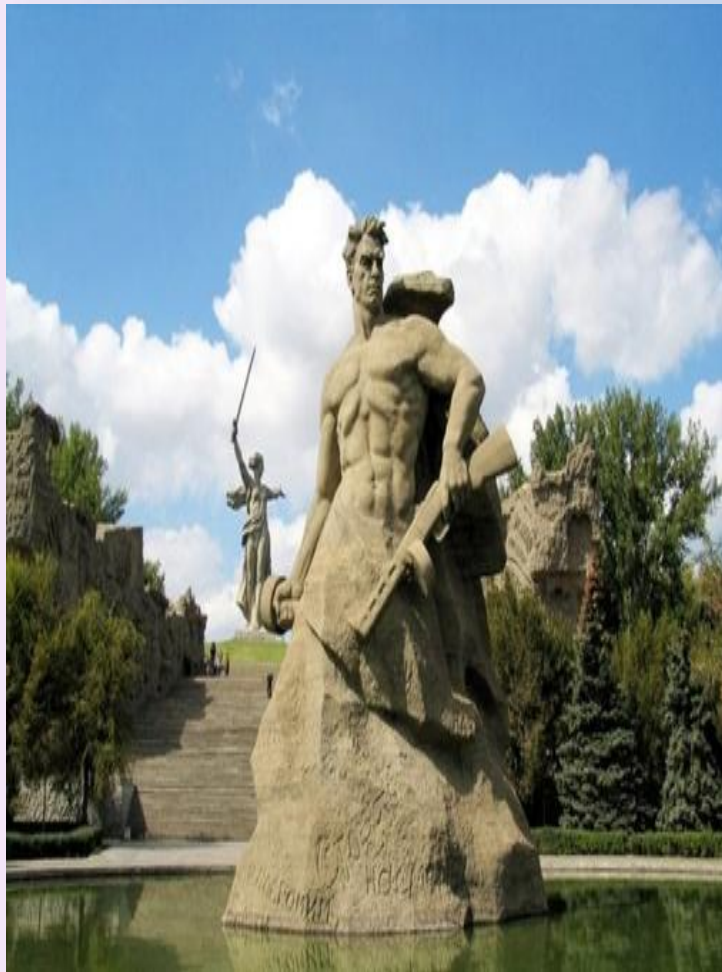
Волгоград, Мамаев курган. Площадь "Стоявших на смерть"

Волгоград один из самых известных и значимых городов носящих звание Города – героя. Летом 1942 года немецко-фашистские войска развернули массированное наступление на южном фронте, стремясь захватить Кавказ, Придонье, нижнюю Волгу и Кубань – самые богатые и плодородные земли СССР. В первую очередь, под удар попал город Сталинград, наступление на который было поручено 6-ой армии под командованием генерал-полковника Паулюса.