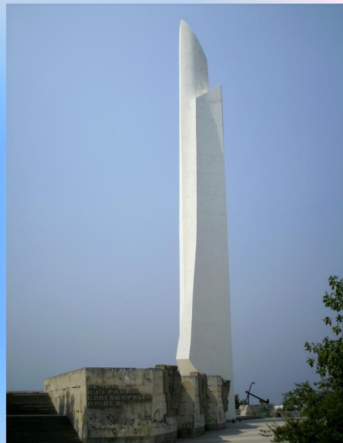
Обелиск "Штык-парус" в честь присвоения Севастополю звания города героя.

Первый раз Севастополь подвергся атаке 11 ноября 1941 г. Немецко-фашистская армия 10 дней подряд пытались прорваться к городу – герою силою четырех пехотных дивизий, но безуспешно. Вторую попытку овладеть городом гитлеровцы предприняли в период с 7 по 31 декабря 1941 г. Но и эта попытка агрессии провалилась. Бои за освобождение Севастополя начались 15 апреля 1944 г, когда советские воины вышли к оккупированному городу. Особенно ожесточенные сражения велись на участке, прилегающем к Сапун-горе. Девятого мая 1944 г., солдатами 4-го Украинского фронта, совместно с моряками