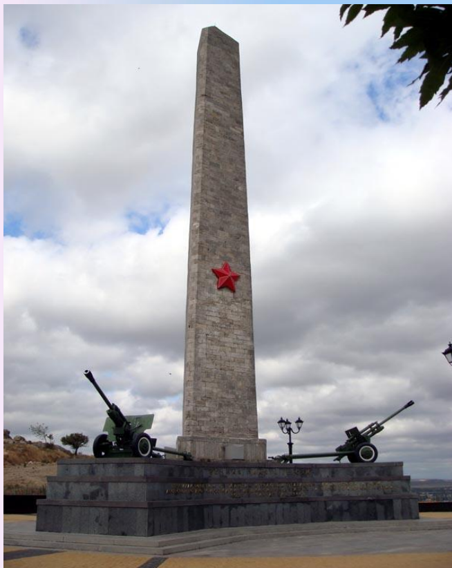
Обелиск Славы на горе Митридат

Керчь была одним из первых городов, попавших под удар немецко-фашистских войск в начале войны. За все время через нее четырежды проходила линия фронта и за годы войны город был дважды оккупирован немецко-фашистскими войсками. Первый раз город был захвачен в ноябре 1941 г, после кровопролитных сражений. Но уже 30 декабря, в ходе Керченско-Феодосийской десантной операции, Керчь освободили войска 51-й армии.