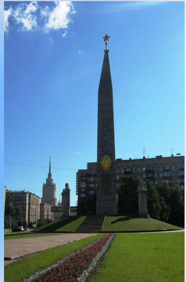
Город герой Москва. Главный монумент мемориала Победы.

В результате завязавшейся ожесточенной битвы, которая продолжалась более 200 дней, враг был отброшен к западу от Москвы на 80-250 км. Это событие укрепило дух всего советского народа и Красной Армии, разбило распространяемый гитлеровцами миф о непобедимости их армии.