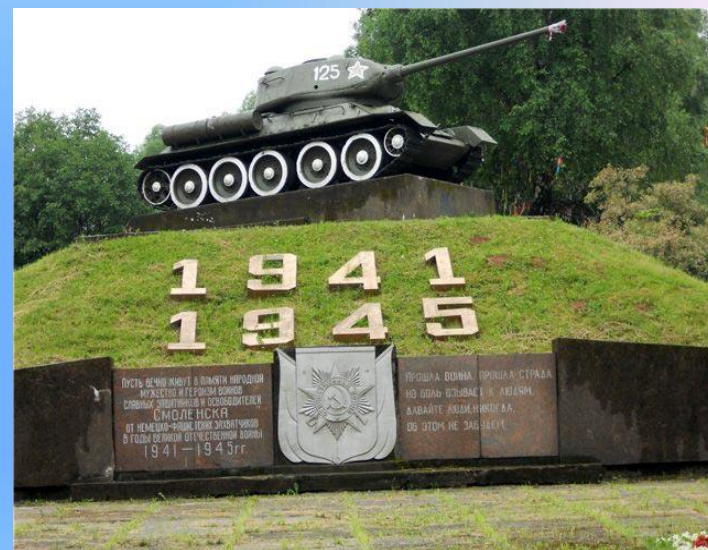
Мемориал Великой Отечественной войны

Решающей битвой в ходе Смоленского сражения была битва за ликвидацию Ельнинского выступа. В ходе ее, советские солдаты-герои разгромили пять дивизий фашистов и 6 сентября 1941 г. освободили город Ельню, остановив тем самым наступление гитлеровцев на московском направлении фронта