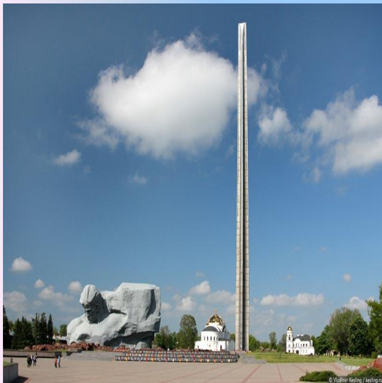
«Штык» Брестской крепости, установленный в центре цитадели.

Из всех городов Советского Союза, именно Бресту выпала участь первым столкнуться с агрессией немецко-фашистских захватчиков. Ранним утром 22 июня 1941 г. вражеской бомбардировке подверглась Брестская крепость, в которой на тот момент находились примерно 7 тысяч советских воинов и члены семей их командиров.