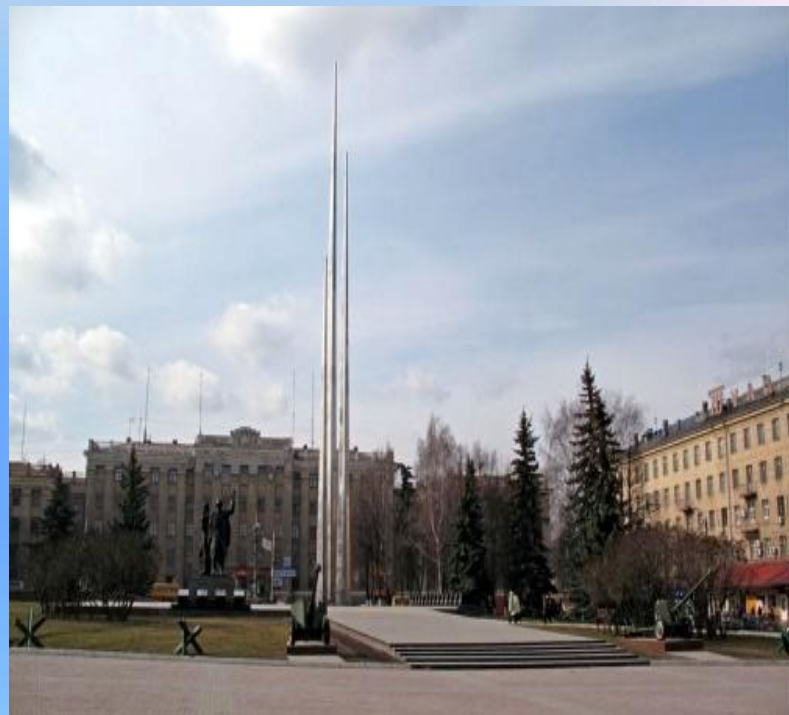
Мемориал в честь героев - защитников Тулы.

В результате, город выстоял! Враг не смог его захватить.