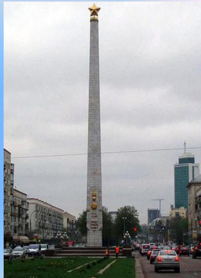
Обелиск Город - Герой