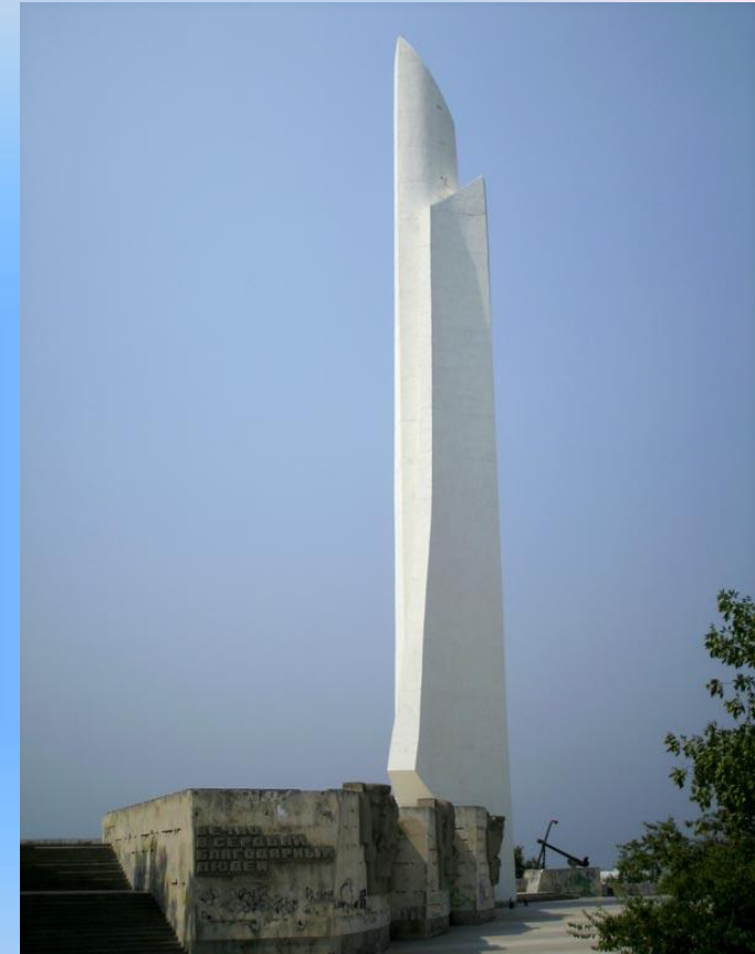
Обелиск "Штык-парус" в честь присвоения Севастополю звания города героя.

Первый раз Севастополь подвергся атаке 11 ноября 1941 г. Немецко-фашистская армия 10 дней подряд пытались прорваться к городу – герою силою четырех пехотных дивизий, но безуспешно. Вторую попытку овладеть городом гитлеровцы предприняли в период с 7 по 31 декабря 1941 г. Но и эта попытка агрессии провалилась. Бои за освобождение Севастополя начались 15 апреля 1944 г, когда советские воины вышли к оккупированному городу. Особенно ожесточенные сражения велись на участке, прилегающем к Сапун-горе. Девятого мая 1944 г., солдаты 4-го Украинского фронта, совместно с моряками