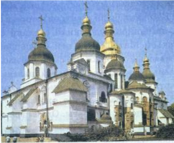
Святая София в Киеве

Софийский собор в Киеве заложен в 1037 г. при Ярославе Мудром. Это 13-главый крестово-купольный храм из кирпича-плинфы в соответствии с византийскими архитектурными традициями.