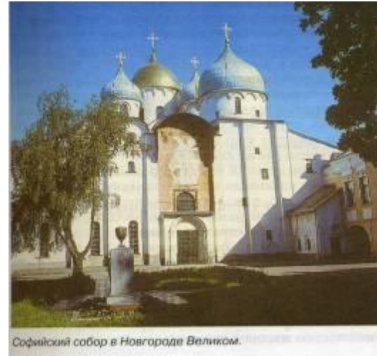
Софийский собор в Новгороде Великом.

Софийский собор в Киеве заложен в 1037 г. при Ярославе Мудром. Это 13-главый крестово-купольный храм из кирпича-плинфы в соответствии с византийскими архитектурными традициями.