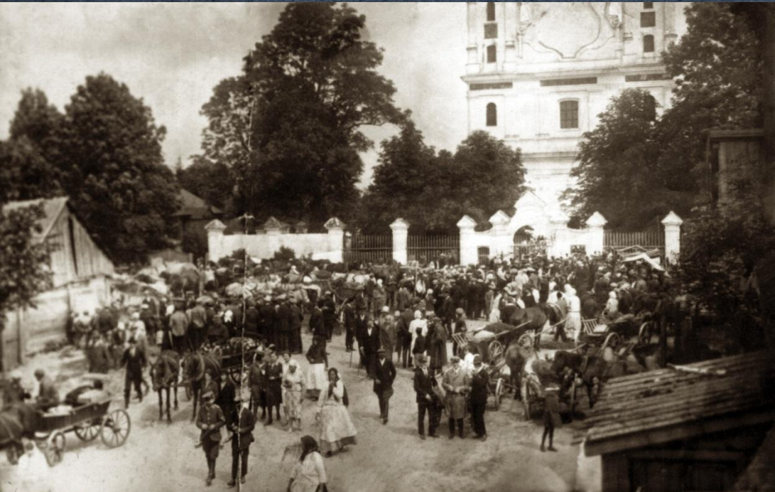
місто Дубровиця, площа біля костелу Іоанна Хрестителя, 20-30 роки ХХ ст.