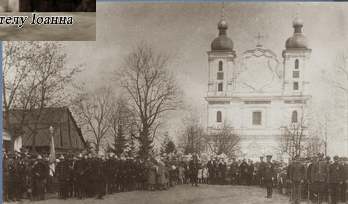
Uroczystości 3-go maja w Dubrowicy 1931 r. Урочистості 3-го травня в Дубровиці, 1931 рік (польськ.)