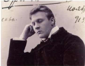
Ф. И. Шаляпин