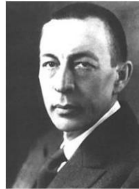
С. В. Рахманинов

Выдающийся композитор Н.А. Римский-Корсаков продолжал работать в излюбленном им жанре оперы-сказки. Высочайшим образцом реалистической драмы явилась его опера «Царская невеста» (1898). Он, будучи профессором петербургской консерватории по классу композиции, воспитал целую плеяду талантливых учеников: А.К. Глазунов, А.К. Лядов, Н.Я. Мясковский и другие.