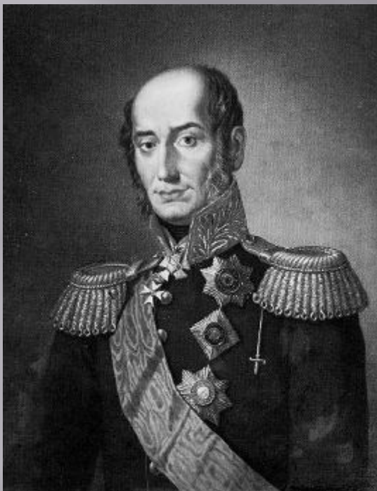
Барклай де Толли