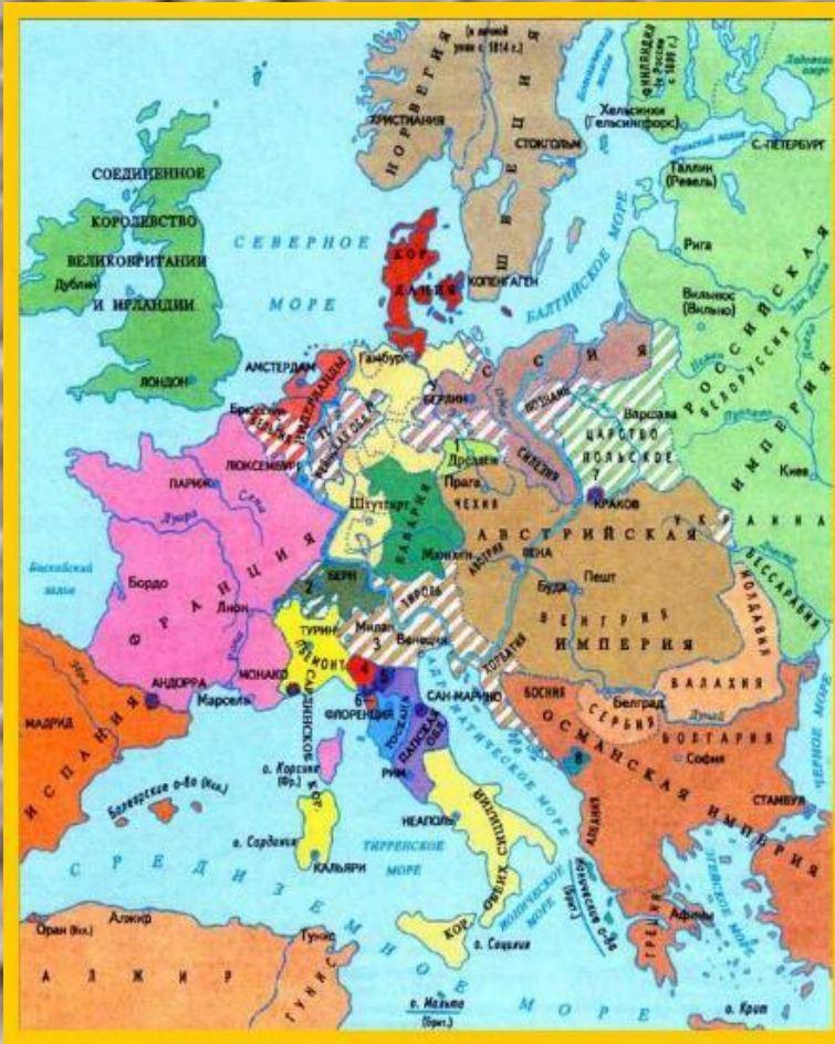
Европа после Венского конгресса