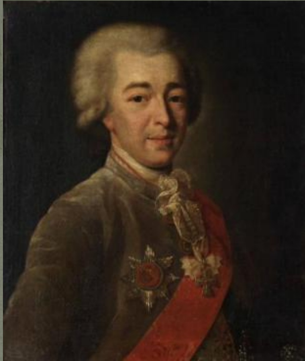
А. Б. Куракин