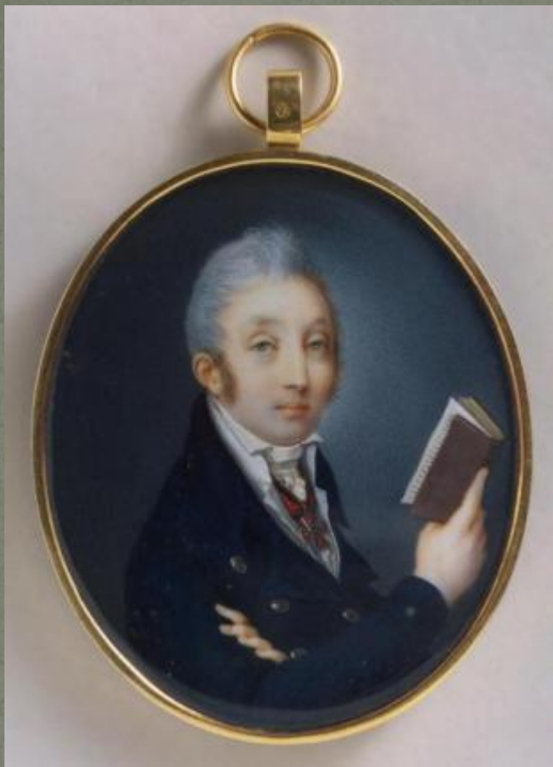
Михаил Михайлович Сперанский