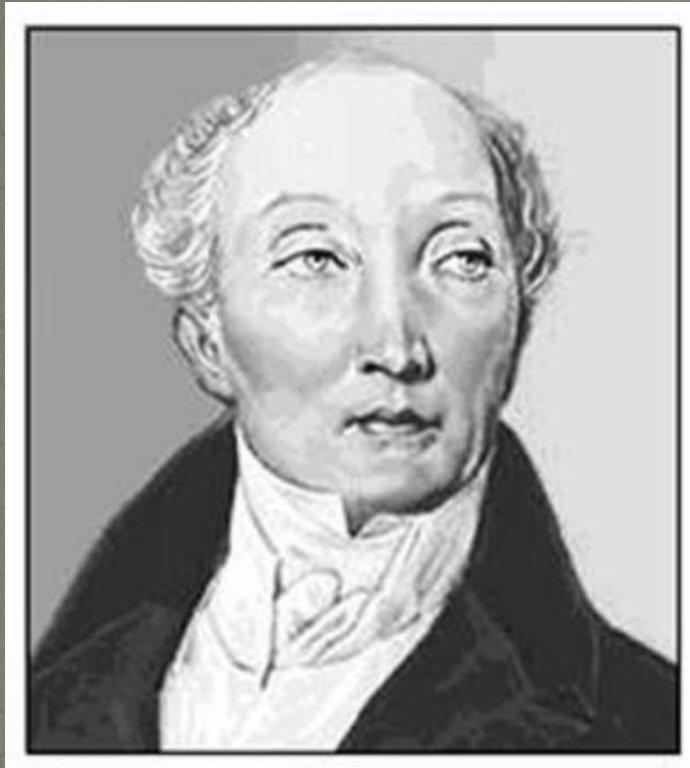
Михаил Михайлович Сперанский

Реформы, проводимые Сперанским, затронули практически все слои российского общества. Это вызвало бурю недовольных возгласов со стороны дворянства и чиновничества, чьи интересы были затронуты более всего. Всё это отрицательно сказалось на положении самого государственного советника. Просьбу об отставке в феврале 1811 г. Александр I не удовлетворил, и Сперанский продолжил работу. Но дальнейшее течение дел и времени приносило ему все новых и новых недоброжелателей. В последнем случае Михаилу Михайловичу припомнили Эрфурт и встречи с Наполеоном. Этот упрек в условиях обострившихся российско-французских отношений было особенно тяжелым. Интрига всегда играет большую роль там, где существует режим личной власти. К самолюбию прибавлялась в Александре чрезвычайная боязнь насмешки над собой. Если кто-либо засмеется его присутствию, на него посматривая, Александр тут же начинал думать, что это над ним смеются. В случае со Сперанским противники реформ выполнили такую задачу блестяще.