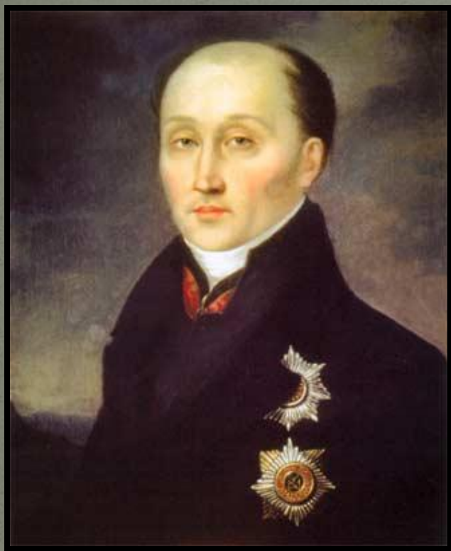
Михаил Михайлович Сперанский