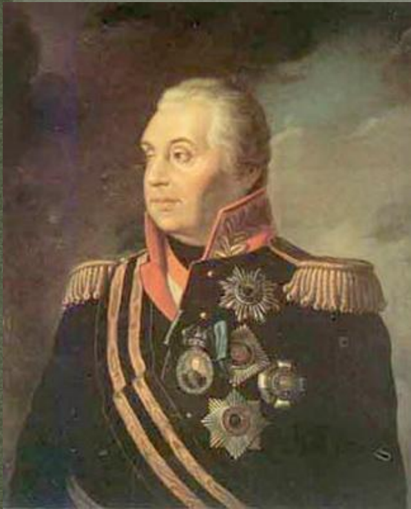
Кутузов М. И.