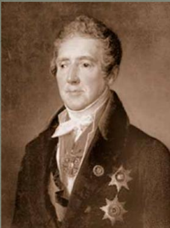
И. И. Дмитриев

И. И. Дмитриев, возглавлявший в те времена Министерство юстиции, позднее вспоминал, что М. М. Сперанский был у В. П. Кочубея «самым способным и деятельным работником. Все проекты новых постановлений и его ежедневные отчеты по Министерству им писаны. Последние имели не только достоинство новизны, но и со стороны методического расположения, весьма редкого и поныне в наших приказных бумагах, исторического изложения по каждой части управления, по искусству в слоге могут послужить руководством и образцами». Фактически Сперанский положил начало преобразованию старого русского делового языка в новый. 20 февраля 1803 г при непосредственном участии Сперанского (концепция, текст) был опубликован знаменитый указ «о свободных (вольных) хлебопашцах». Согласно этому указу помещики получили право отпускать крепостных на «волю», наделяя их землей. За годы царствования Александра I было освобождено всего 47 тысяч человек. Вдохновленный «записками» молодого деятеля царь через В. П. Кочубея поручает Сперанскому написать капитальный трактат-план преобразования государственной машины империи, и он с жаром отдается новой работе.