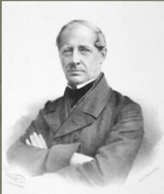
М. А. Корф

Неоднократно слышал их, по-видимому, и государь. Однако взгляды были сконцентрированы в одном документе, написанном живо, ярко, убедительно, на основе исторических фактов и человеком, не близким ко двору, не облеченным властью, которую боялся бы потерять. Эта записка Карамзина сыграла решающую роль в отношении к Сперанскому. Вместе с тем самоуверенность самого Сперанского, его неосторожные упреки в адрес Александра I за непоследовательность в государственных делах, в конечном итоге переполнили чашу терпения и вызвали раздражение императора. Из дневника барона М. А. Корфа. Запись от 28 октября 1838 года: «Отдавая полную высокую справедливость его уму, я никак не могу сказать того же об его сердце. Я разумею здесь не частную жизнь, в которой можно его назвать истинно добрым человеком, ни даже суждения по делам, в которых он тоже склонен был всегда к добру и человеколюбию, но то, что называю сердцем в государственном или политическом отношении — характер, прямоту, непоколебимость в избранных однажды правилах. Сперанский не имел... ни характера, ни политической, ни даже частной правоты». Многим своим современникам Сперанский показался именно таким, каким обрисован он главным своим биографом в только что приведенных словах.