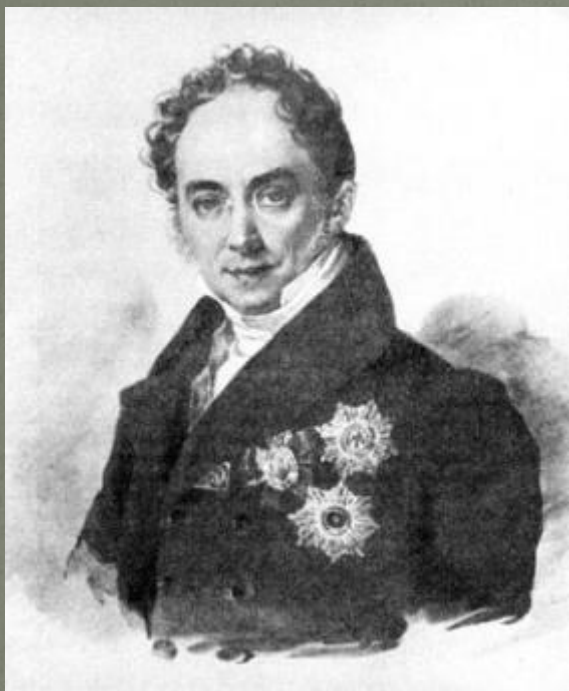
В. П. Кочубей

Летом 1801 г. В. П. Кочубей взял Сперанского в свою «команду». В это время в «Негласном комитете» шла работа по разработке министерской реформы. Указом от 8 сентября 1802 г. в России учреждались восемь министерств. Министры имели право личного доклада императору. В. П. Кочубей возглавил Министерство внутренних дел. Он по достоинству оценил способности Сперанского и уговорил Александра I, чтобы тот позволил Михаилу Михайловичу работать под его руководством, статс-секретарём. В 1802—1804 годах Сперанский подготовил несколько собственных политических записок: «О коренных законах государства», «О постепенности усовершенствования общественного», «О силе общественного мнения», «Ещё нечто о свободе и рабстве», «Записку об устройстве судебных и правительственных учреждений в России». В этих документах он впервые изложил свои взгляды на состояние государственного аппарата России и обосновал необходимость реформ в стране. В июне 1802 г, в возрасте тридцати лет, Сперанский возглавил в Министерстве внутренних дел отдел, которому предписывалось готовить проекты государственных преобразований.