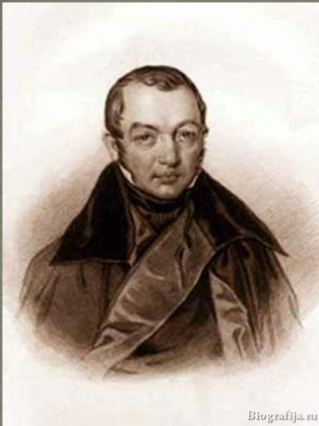
Ф. В. Булгарин

Интересно, что дочь реформатора решительно опровергает эту чрезвычайно устойчивую, кочующую из книги в книгу легенду (сочинённую большим мистификатором Ф. В. Булгариным)... Достоверно известно, что Сперанский получил в награду от Наполеона за участие в сложных переговорах золотую табакерку (со своим портретом), усыпанную бриллиантами. Новому владельцу политических дивидендов табакерка не прибавила. Над ним сгущались тучи. В Эрфурте Александр позже обратился к Сперанскому с вопросом, как ему нравится за границу. Сперанский отвечал: у нас люди лучше, а здесь лучше установления. Когда они возвратились, в том же году император дал ему поручение составить план общей политической реформы. Александр I назначил Сперанского товарищем (то есть заместителем) министра юстиции и одновременно сделал его главным советником в государственных делах. План реформ в виде обширного документа «Введение к уложению государственных законов», был как бы изложением мыслей, идей и намерений не только реформатора, но и самого государя. Сперанский стал определять внутреннюю и внешнюю политику государства.