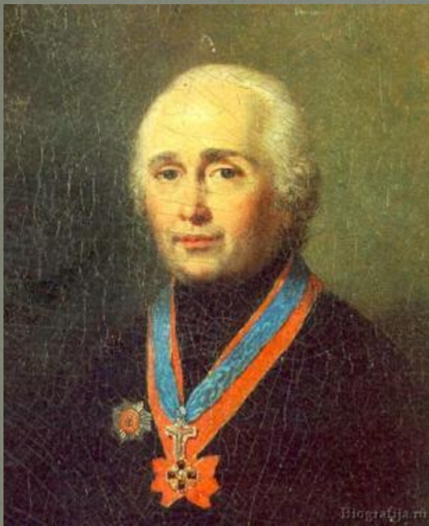
Андрей Афанасьевич Самборский