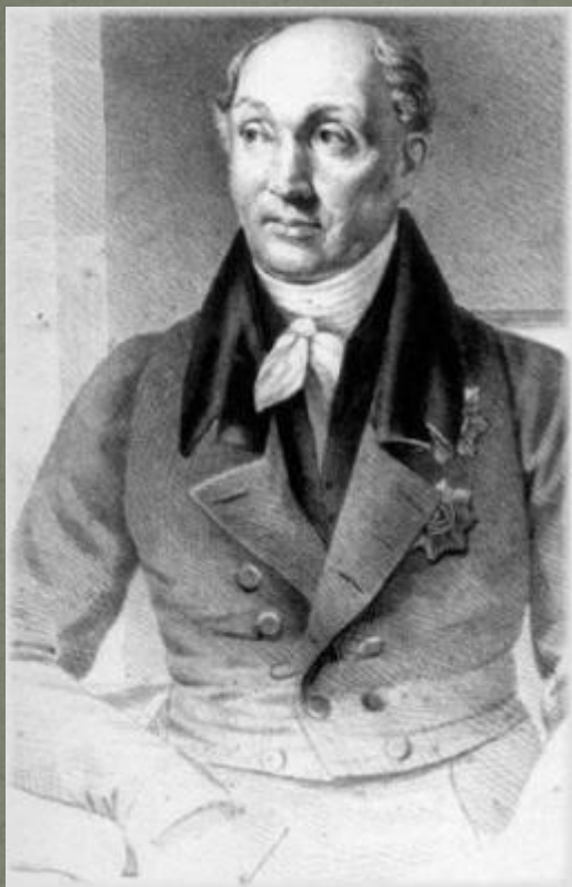
Михаил Михайлович Сперанский

В Александро-Невскую семинарию направлялись лучшие слушатели провинциальных семинарий со всей России. В их число удостоился чести попасть и Михаил Михайлович Сперанский, по направлению прибывший в столицу. Свободно овладев французским, он увлекся просветительской философией, что наложило несмываемый отпечаток на него в будущем. Выдающийся ум и независимость суждений проявляются в ученических проповедях Сперанского. Лучшему студенту (как и во Владимире — Сперанскому) священноначалие доверило произносить проповеди. 8 октября 1791 года он произнёс в Александро-Невской лавре необычайно смелое наставление в присутствии знаменитого митрополита Гавриила. Речь его содержала обращение к государю с предостережением и рассказывала об «истинном и ложном просвещении». Свои свободные часы, в отличие от большинства своих товарищей, Сперанский предпочитал проводить не в доступных развлечениях, а в чтении имеющихся книг. Это время в его жизни было периодом интенсивных движений ума, и окончательного духовного созревания. Все это позволило Сперанскому стать одним из наиболее эрудированных семинаристов.