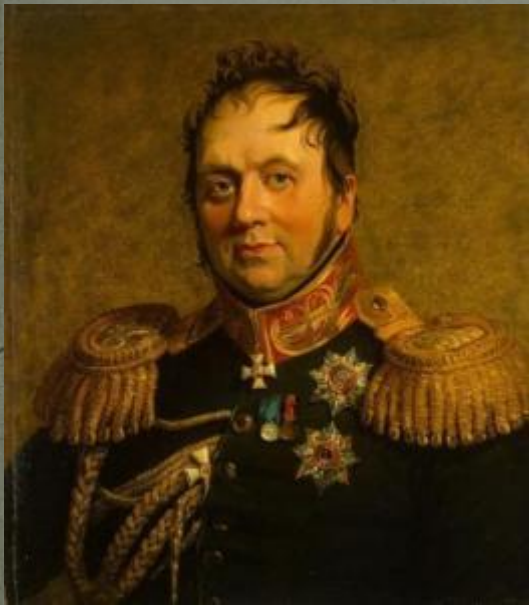
Шведский барон Густав Армфельд

Сговорившись между собой, участники интриги стали с некоторых пор регулярно сообщать государю разные дерзкие отзывы, исходящие из уст его госсекретаря. Но Александр не стремился прислушиваться, так как в отношениях с Францией были проблемы, а предостережения Сперанского о неизбежности войны, его настойчивые призывы готовиться к ней, конкретные и разумные советы не давали оснований для сомнений в преданности его России. В день своего 40-летия Сперанский был удостоен орденом Александра Невского. Однако ритуал вручения прошёл непривычно строго, и стало ясно, что «звезда» реформатора начинает тускнеть. Недоброжелатели (среди которых был Шведский барон Густав Армфельд, председатель комитета по делам Финляндии, и А. Д. Балашов, руководитель Министерства полиции.) Сперанского ещё больше активизировались. Они передавали Александру все сплетни и слухи о госсекретаре. Но возможно, эти отчаянные доносы в конечном счёте не возымели бы сильного действия на императора, если б весной 1811 г лагерь противников реформ не получил вдруг идейно-теоретического подкрепления. В Твери вокруг сестры Александра Екатерины Павловны сложился кружок людей недовольных либерализмом государя и в особенности деятельностью Сперанского.