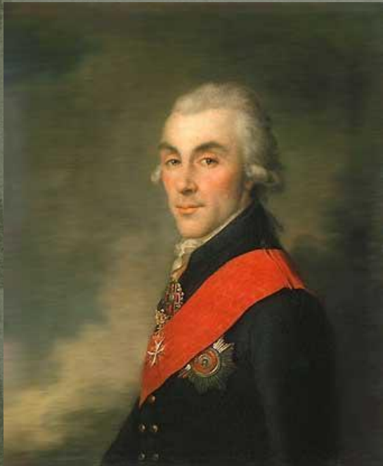
Аракчеев А. А.

Отправляясь в ссылку, он не знал, какой приговор вынесен ему в Зимнем дворце. Отношение в простом народе к Сперанскому было противоречивое, как отмечает М. А. Корф: «...местами ходил, довольно громкий говор, что государев любимец был оклеветан, и многие помещичьи крестьяне даже отправляли за него задравные молебны и ставили свечи. Дослужась, — говорили они, — из грязи до больших чинов и должностей и быв умом выше всех между советниками царскими, он стал за крепостных..., возмутив против себя всех господ, которые за это, а не за предательство какое-нибудь, решились его погубить». Тем не менее, обвинение в измене не списывалось со счетов. В 1814 г. Сперанскому было разрешено проживание под полицейским надзором в своем небольшом имении Великополье Новгородской губернии. Здесь он встречался с Аракчеевым А. А. и через него ходатайствовал перед Александром I о своем полном «прощении». М. М. Сперанский неоднократно обращался к императору и министру полиции с просьбой разъяснить его положение и оградить от оскорблений. Эти обращения возымели последствия: распоряжением Александра надлежало выплатить Сперанскому по 6 тысяч рублей в год с момента высылки. Данный документ начинался словами: «Пребывающему в Перми тайному советнику Сперанскому...». Кроме того, распоряжение было свидетельством, что император Сперанского не забывает и ценит.