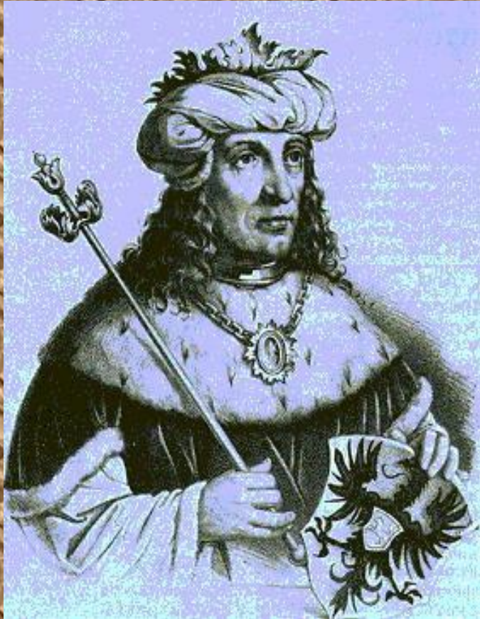
Генрих I Птицелов – первый германский король