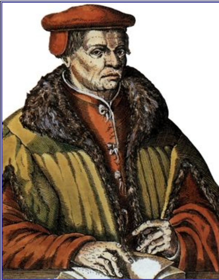
Томас Мюнцер – вождь народной Реформации

1524-1525 гг. – крестьянская война (народная Реформация)