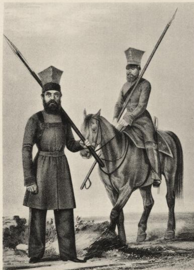
ПЕШИЙ И КОННЫЙ ВОИНЫ Нижегородского ополчения, 1812-1818.

9 декабря 1812 года Нижегородское ополчение в составе 5 пехотных полков и одного конного двинулось на Арзамас. В этом городе проходил смотр войск, а потом все ополчение в составе около 13 тысяч нижегородцев было направлено в действующую армию. Путь ополченцев лежал через Муром, Рязань, Орел - на Украину.