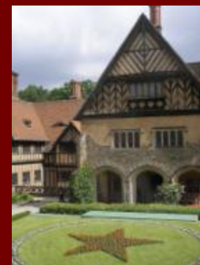
Дворец Цецилиенхоф — место проведения Потсдамской конференции