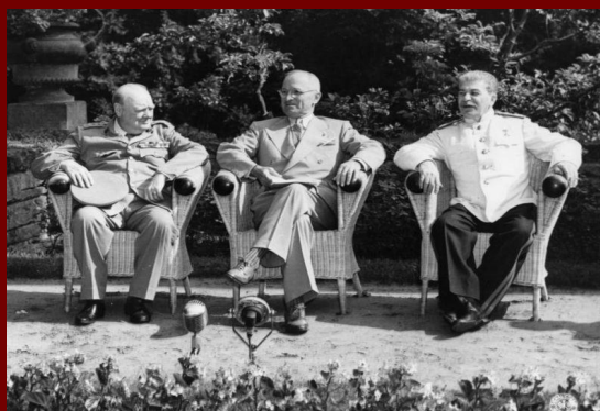
У. Черчилль, Г. Трумэн, И. Сталин