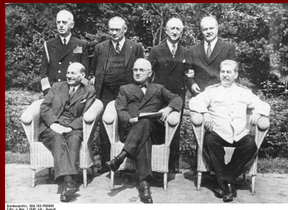
К. Эттли, Г.Трумэн, И. Сталин