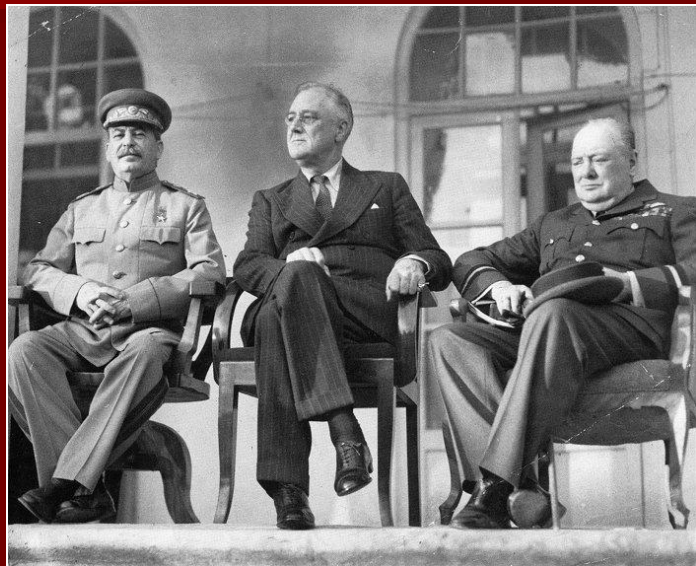
И.В. Сталин, Ф.Д. Рузвельт, У. Черчилль