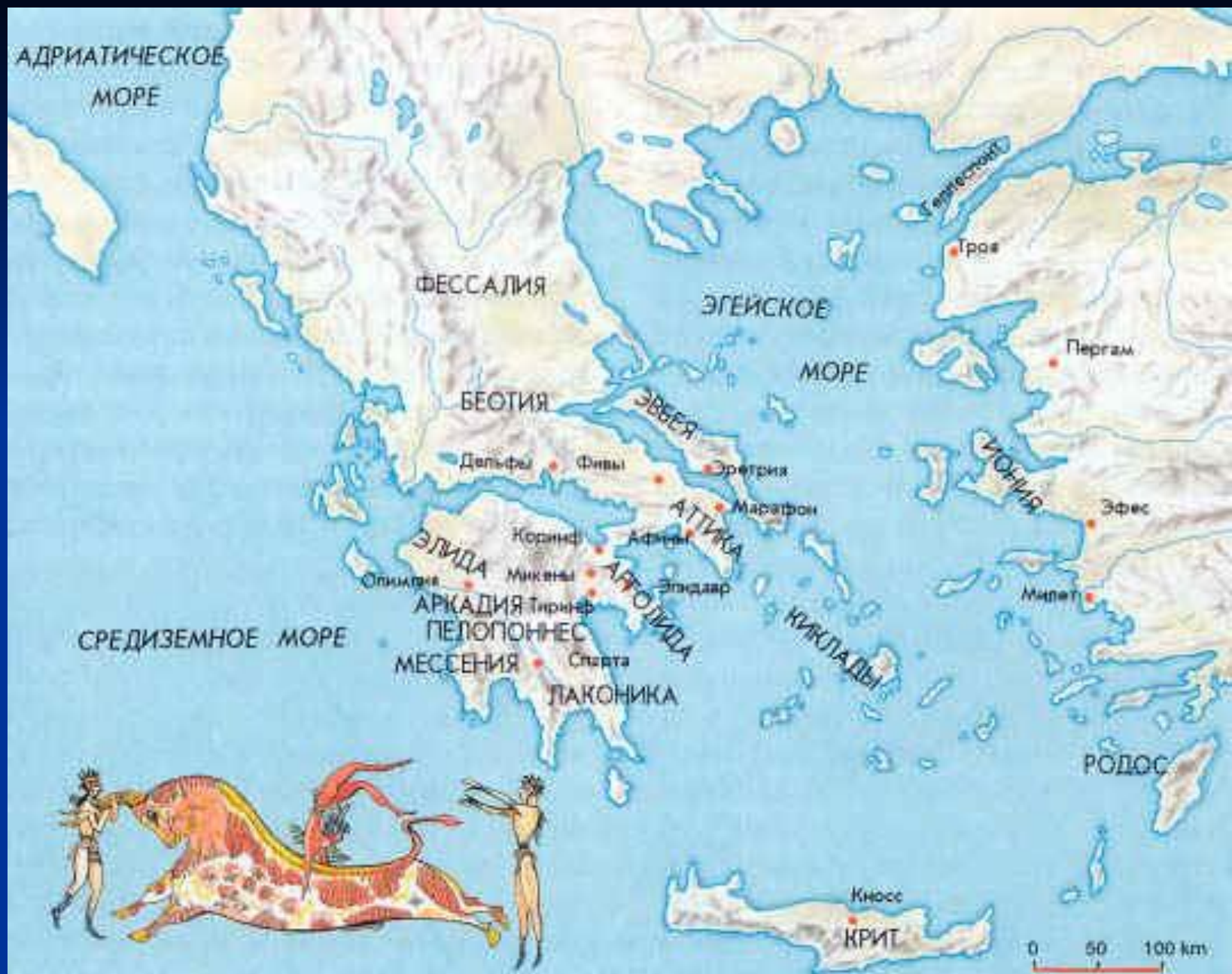
Греция VIII-VI вв.