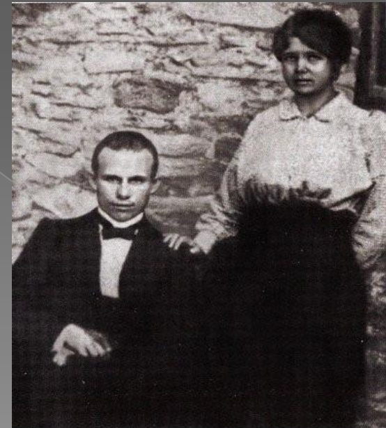
Никита Хрущёв с женой, 1916 год