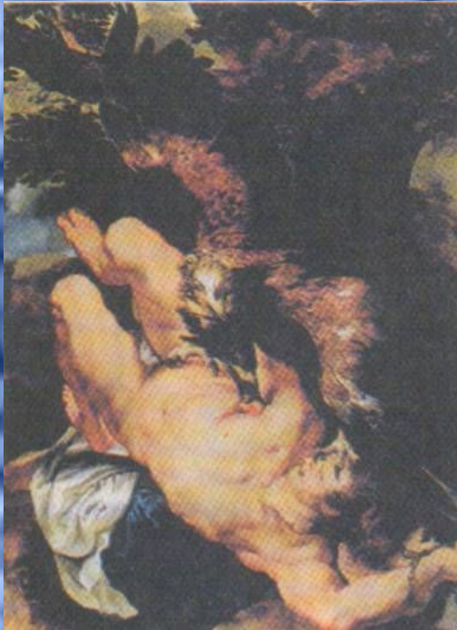
П.Рубенс и Ф. Снайдерс. «Прикованный Прометей»