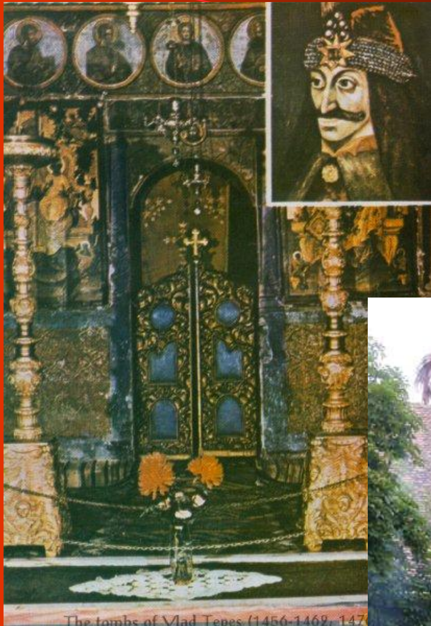
The tombs of Vlad Tepes (1456-1462, 1476-1477)