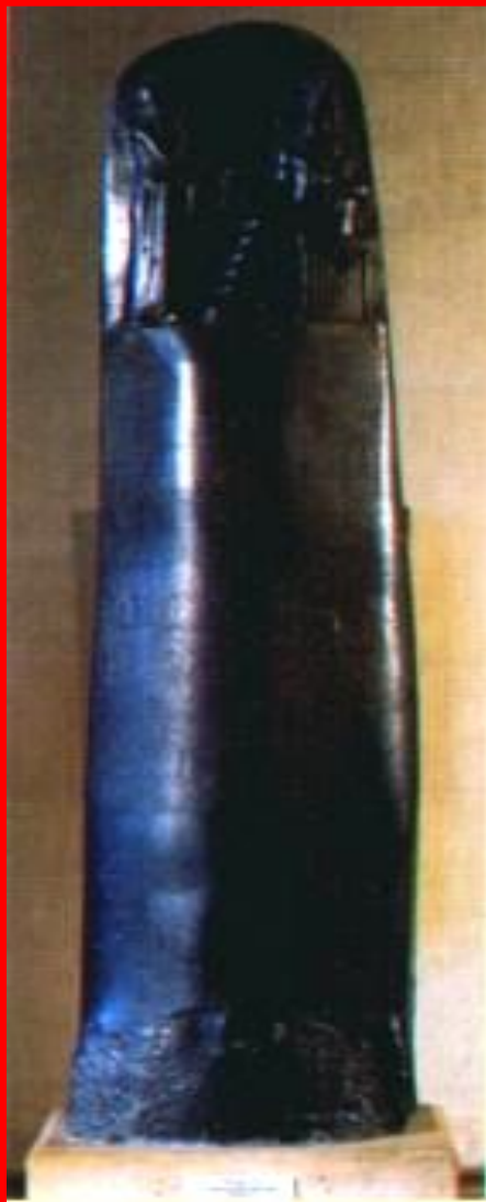
Стелла с законами Хаммурапи из Суз.