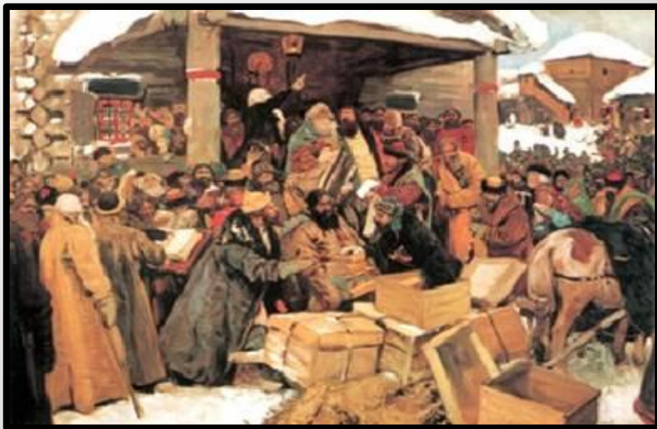
А.Иванов. Во времена раскола.

В середине 17 века стало ясно, что в русских церковных книгах, переписывающихся от руки из века в век, имеется много описок и искажений текста в сравнении с оригиналом.