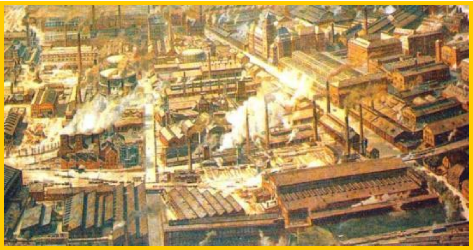
Металлургический завод в Эссене