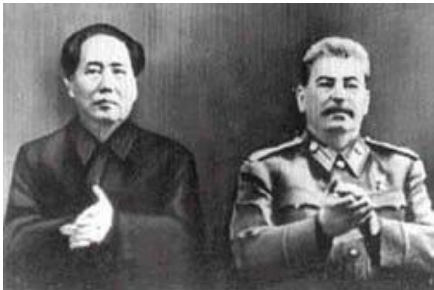
Мао Цзедун и Иосиф Сталин