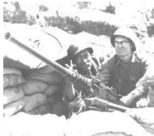
Солдаты армии США в Корее