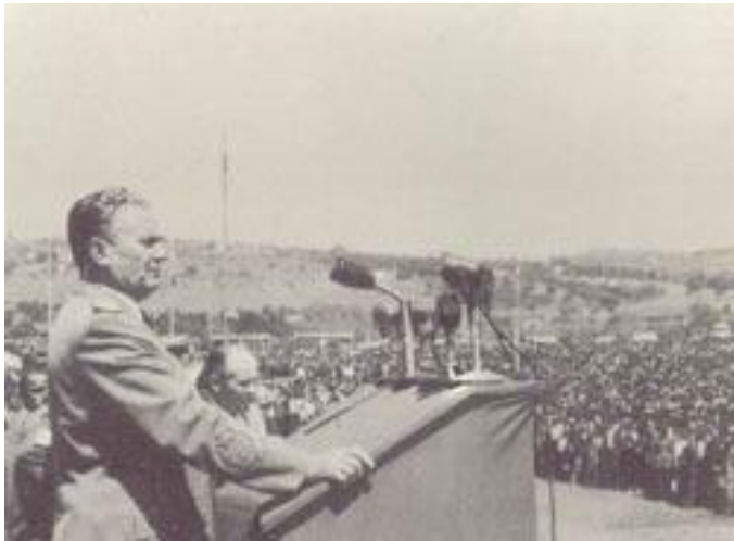
Иосип Броз Тито