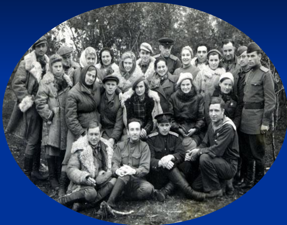
Фронтowej филиал Малого театра, сентябрь 1943 года

За время войны было создано около 3800 театрально-концертных бригад, которые давали концерты на передовых позициях, кораблях, аэродромах, в госпиталях - на всех бесконечных дорогах войны. Всего на фронт выезжало более 42000 артистов. Особой любовью у бойцов пользовались такие коллективы, как фронтовые филиалы театра имени Евг. Вахтангова, Малого театра, фронтовые театры ВТО, театры "Искра", "Веселый десант", "Огонек" и другие.