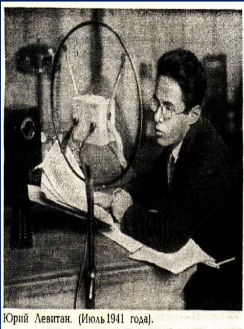
Юрий Левитан. (Июль 1941 года).