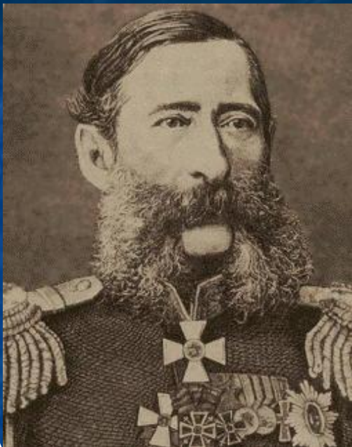
М. I. Лорис-меликов (1825-1888)

Начальник Верховной распорядительной комиссии при МВД