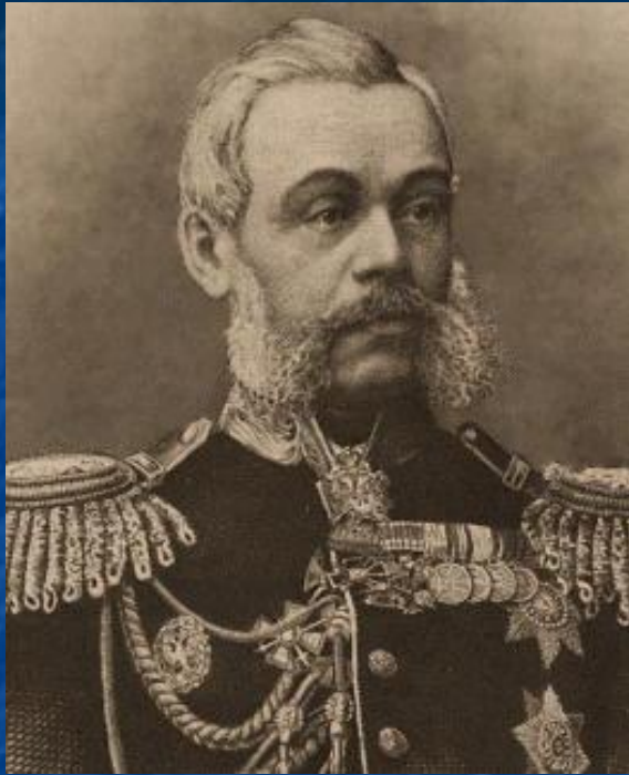
Д.А.Милютин военный министр