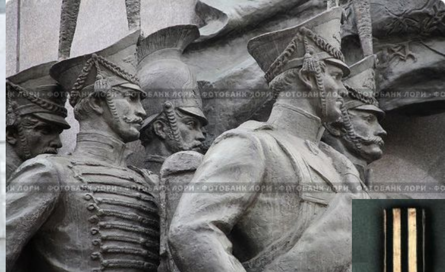
Солдатский знак отличия военного ордена.