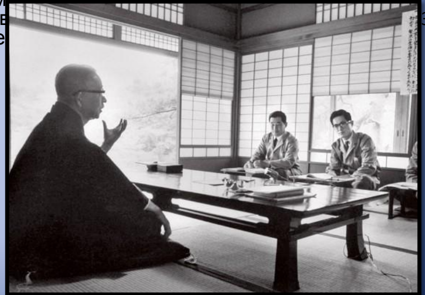
Основатель Matsushita Electric Коносуке Мацусита