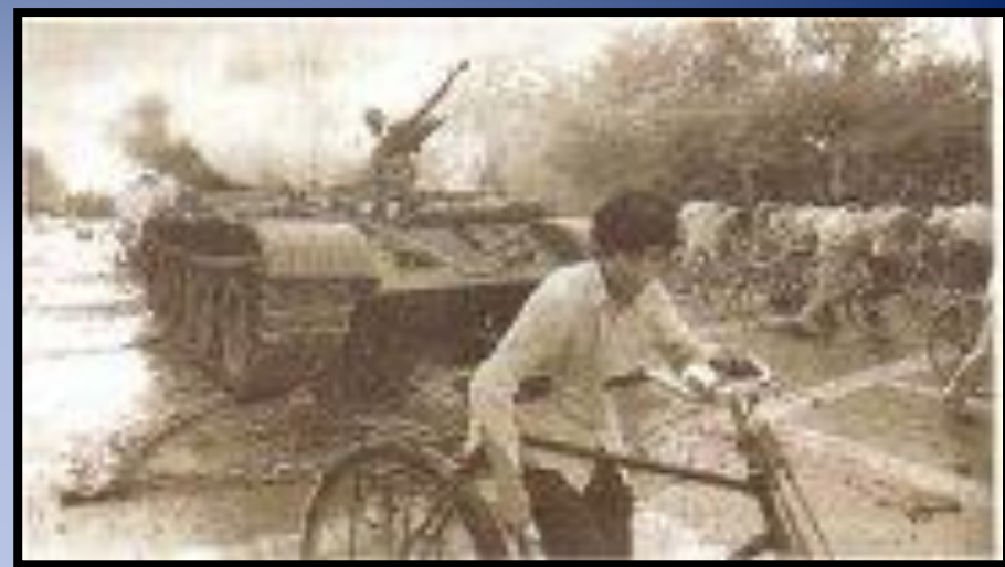
Площадь Тяньаньмэнь Июнь

Политико-идеологические основы общества в ходе реформ почти не подверглись изменениям. КПК следовала учению марксизма-ленинизма и идеям Мао Цзэдуна (правда, в уставе партии была сделана оговорка о недопустимости культа личности). В 1987 г. партийный съезд поставил задачу движения «по пути социализма с китайской спецификой».