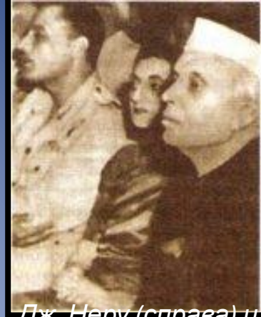
Дж. Неру (справа) и И. Ганди на конгрессе

В 1980-е годы в Индии стали активизироваться националистические и сепаратистские движения. Столкновения между индусами и мусульманами, борьба сикхов за автономию, а затем за отделение от Индии, выступления тамильских сепаратистов на юге страны привели к многочисленным жертвам. От рук террористов погибли И. Ганди (1984) и Р. Ганди (убит в 1991 г. во время поездки по стране в ходе предвыборной кампании).