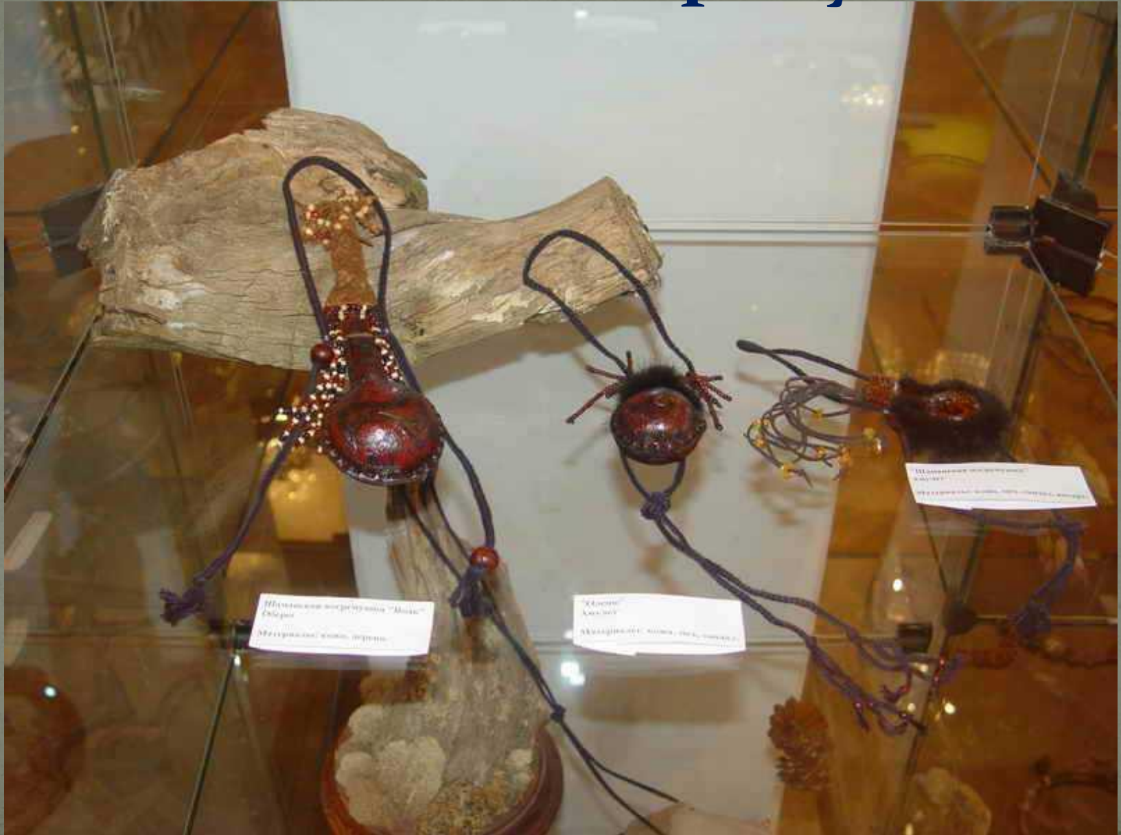
Шаманские погремушки "Мокш" Образ Материалы: кожа, дерево.