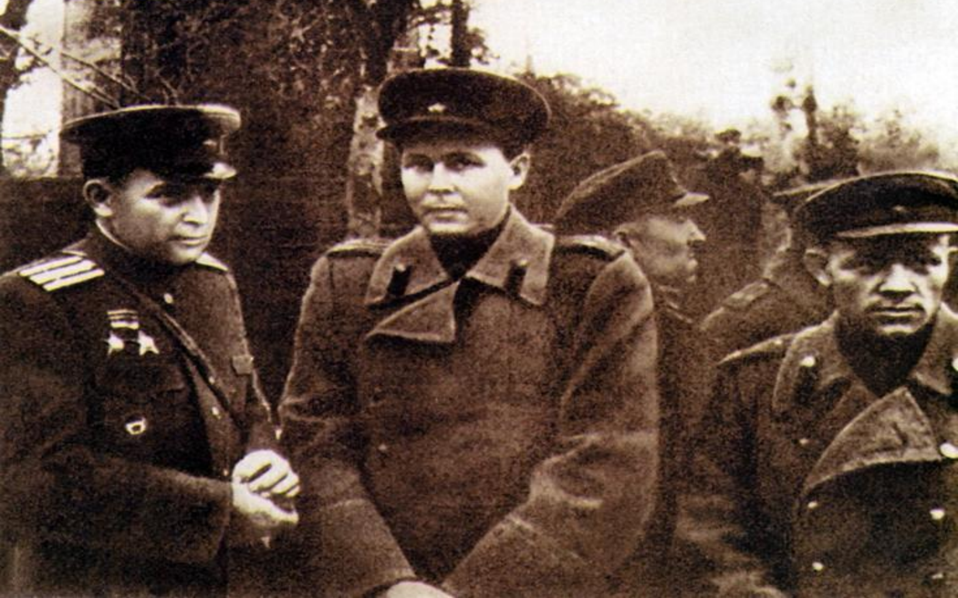
А.Т.Твардовский -военный корреспондент (в центре)